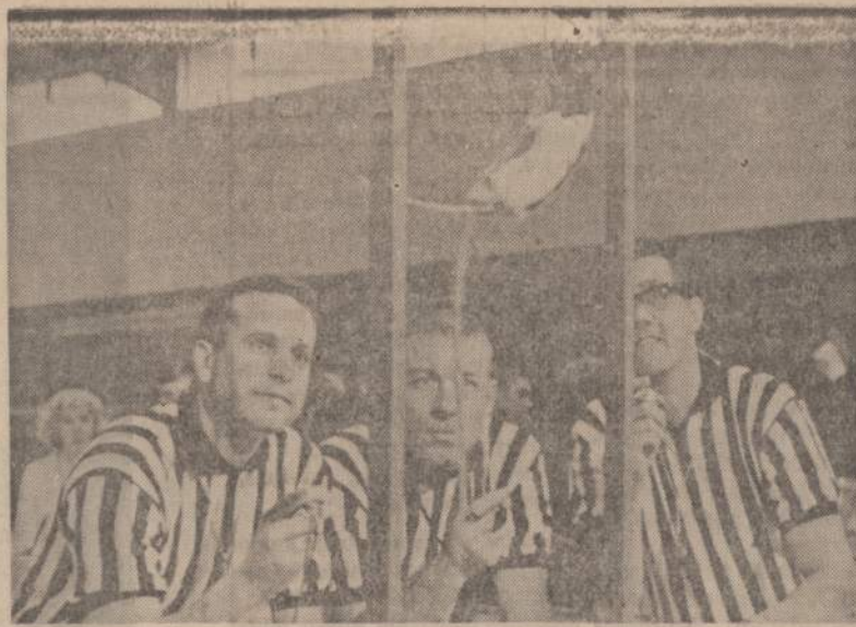
American River kolegijoje, esančioje Sacramento, Cal., mieste, studentai išmokino peles lipiti virve. Trys studentai turės nusipreiti, kuri iš jų pelių greičiausiai virve užlips į palubę.