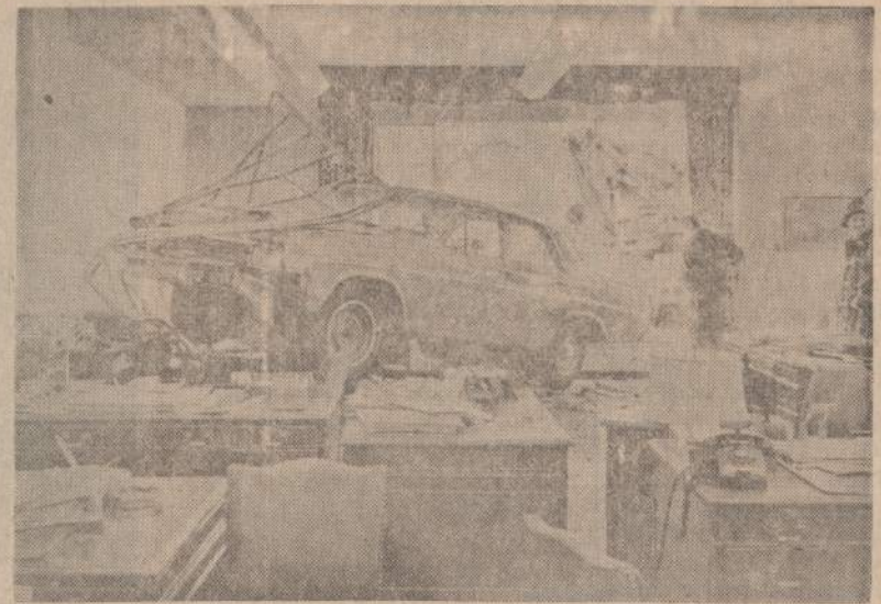
Washington Jefferson taupymo bendrovė yra padariusi daug paskolų žmonėms automobiliams pirkti, bet praėitį savaitę visai netikėtai bendrovės patalpas ivažiuo automobiliai. Vadovybė patenkinta, kad bendrovės pareigūnai išliko gyvi.