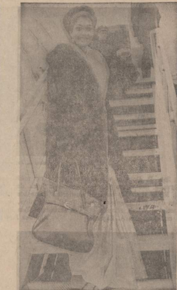
Reita Faria, gražiausioji pasaulio moteris, iš Anglijos skrenda į JAV. Ji buvo priėmusi kartu su artistu Bob Hope skrisi į Vietnamą, bet Indijos valdžia uždraudė. Jeigu ji ten skrisianti, tai valdžia atimsianti iš jos pasą. Reita Faria nori būti gydytoja, ji studijuoja mediciną.