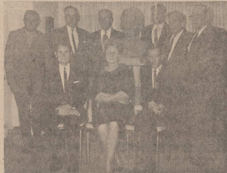
DR. K. GRINIAUS PAMINKLUI STATYTI KOMITETAS

Komitetas sveikina ir būsimus aukotojus šio paminklo statybai, nes kiekviena auka yra labai reikalinga. Auką prašome siųsti į Komiteto sąskaitą Chicago Savings and Loan Association, 6245 So. Western Ave., Chicago, Ill. 60629. Sąskaitos No. 38893.