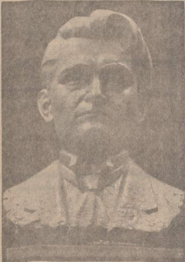
DR. KAZYS GRINIUS