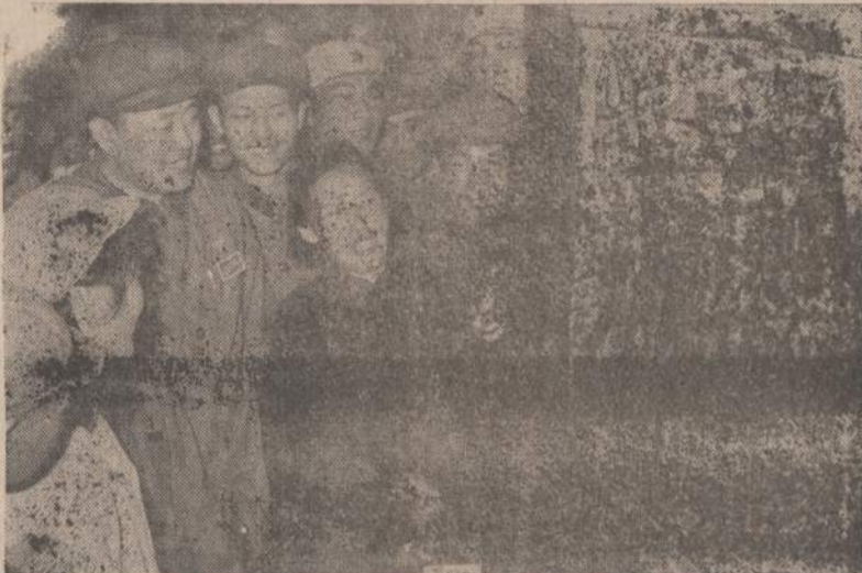
Oficiali fotografija sako, kad ši įtakinga moteris atkino Kinijos kare lėktuvą Mao Čungo evar- besnes mintis apie politines pakaitas komunistinėje valdžioje

MASKVA. — Sovietų Sąjun- gos propagandinis aparatas yra užsuktas įrodinėti, kad Rusijos Sibiro žemės niekada nėra buvu- sios Kinijos rankose. Maskvos radijas eilėje mokslinių paskaitų įrodinėja, kad Amuro upės slė- nyje rastos iškasenos rodo, kad tose srityse gyveno jau prieš tūkstančius metų nekilnias kultūros žmonės.