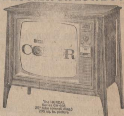
The HURDAL Series GH-600 25" tube (overall diag.) 290 sq. in. picture