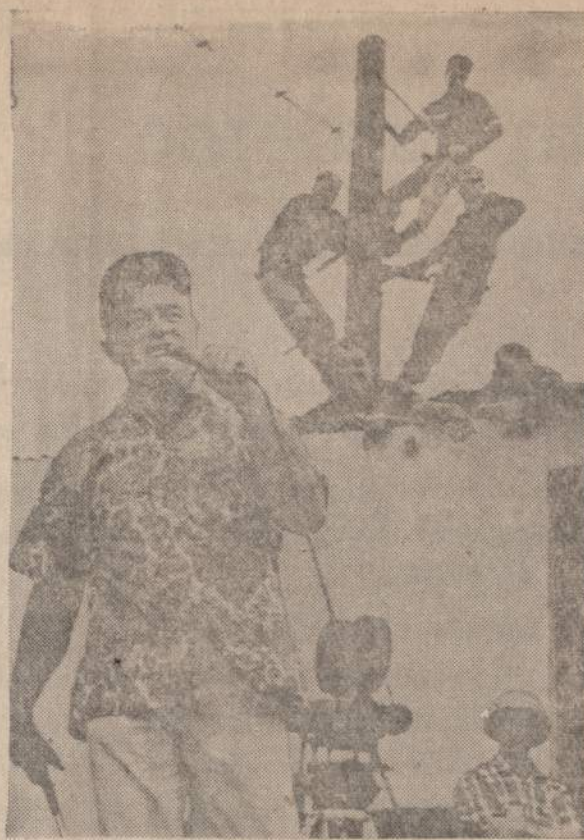
Vietnamo vandenyse Bob Hope pasakoja juokus JAV laivynui. Artistas Hope kartu su grupe geru šokėjų ir dainininkų vaidina ir pasakoja Vietname kvojančiams Amerikos kariams.

Girdėjome ir abejojantių balsus — dargi Lietkoopsąjungos valdyboje — kad, girdi, kai mo vietovėse prekyba mėsa neturi didelių perspektyvų. Girdi, žmonės patys išsiaugina vis daugiau gyvulių. Neteisingas toks požiūris. Taip, gyvulių žmonės dabar augina daugiau. Tačiau auginti gyvulį reikia ištisus metus, o šviežių mėsa žmonės nori valgyti kasdien. Ne sūdytą, ne rūkytą ir dargi ne šaldytą, o šviežią. Prekybininkai turi parodyti daugiau iniciatyvos, apskrumo. Pagirtinos Jurbarko prekybininkų pastangos. Jie superka iš gyventojų gyvulius čia pat, apylinkių centruose juos skerdzia ir mėsa pardavinėja. Žmonės ją noriai perka, nes ir kainoja ji pigiau. Komiso pagrindais pradeda prekiauti mėsa ir kapsukiečiai. Šitai turi savų privalumų: mėsa nereikia toli išvežioti, atkrinta transporto klausimas, be to vietoje geriau žinomi žmonių poreikiai, ir prekybininkai gali parinkti paged-