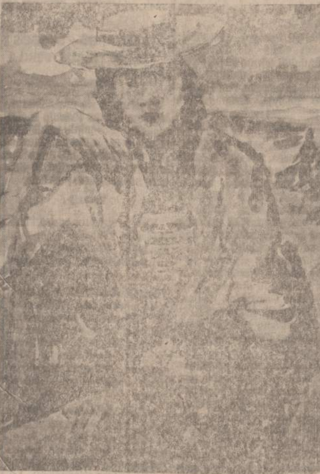
DAIL. BR. MURINAS

Architektūra yra fizinis, funkcionalus menas.