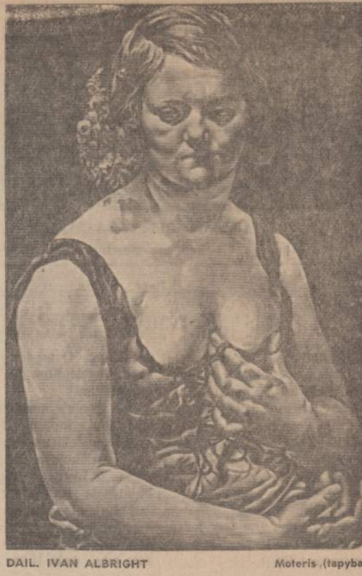
DAIL. IVAN ALBRIGHT