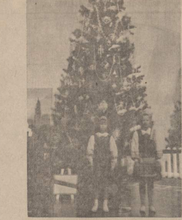
Lietuvių Egulė Chicago Mokslo ir Pramonės muziejuje, Lietuvių programoje.

Pakelėm vakare apsisojom nakvynei pas smulkų ūkininką su lietuviška pavarde. Savo išvaizda ūkis nesiskyrė nuo kitų. Žemės turėjo 8 ha. Ūkyje buvo keturi pastatai, visi mūriniai. Nedidelis, aptvertas pinučiais