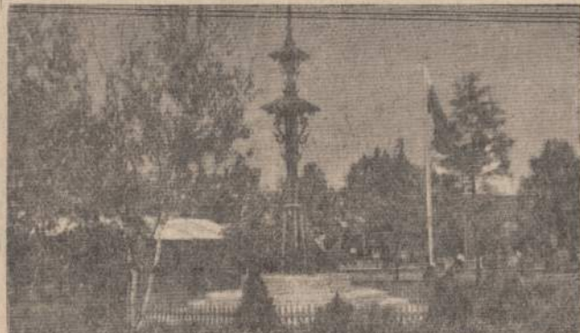
Lietuviškas kryžius New Yorke Pasaulinėje Parodoje

Nepasakyta, kelias dienas jis ligoninėje išbuvo, bet grįžęs namo pasakė: Nuo dienos, kai iš ligoninės grįžau, man alkoholis nebereikalingas. Aš galiu išgyventi dienų dienas ir man net į galvą mintis nebeteina, o jei kartais ateina, man prisimena tas keistas nemalonus ir priklus prieskonis, kokį gaudavau vaistų išgėręs ir vieną, daugiausiai du stikliukus išgėręs. Yra tikras pasibiaurėjimas, bet tai nėra jokia savęs prievartama ar baimė. Man pačiam nesuprantama, kaip mano protas nebeieško pretek-