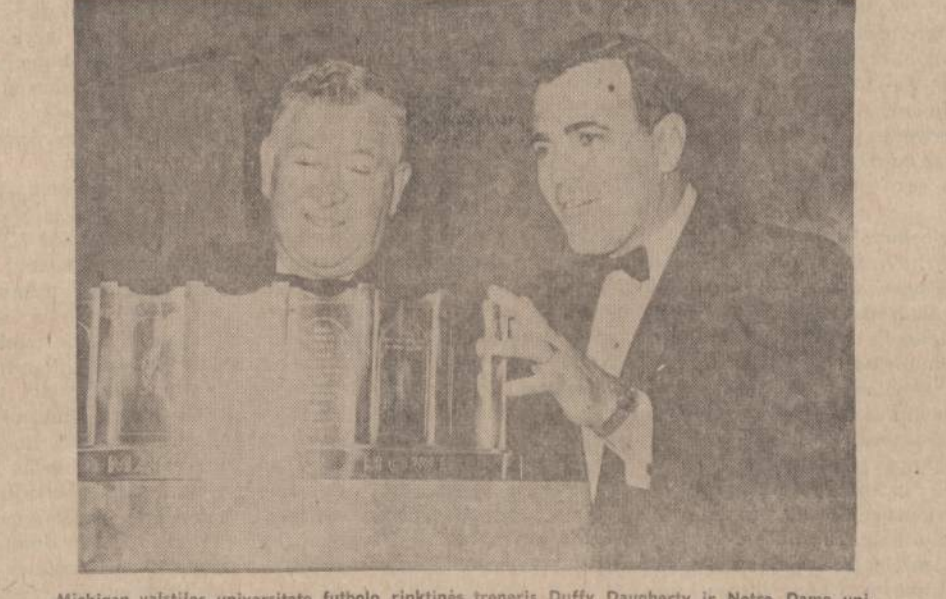
Michigan valstijos universiteto futbolo rinktinės treneris Duffy Daugherty ir Notre Dame universiteto futbolo rinktinės treneris Ara Parseghian gerisio trofėjū, kurį laimėjo jų rinktinės kai-pu geriausios visame krašte. Pirmus šešis mėnesius tą trofėjų laikys Notre Dame, o po to jis bus pasiūstas Michigan valstijos universitetui.