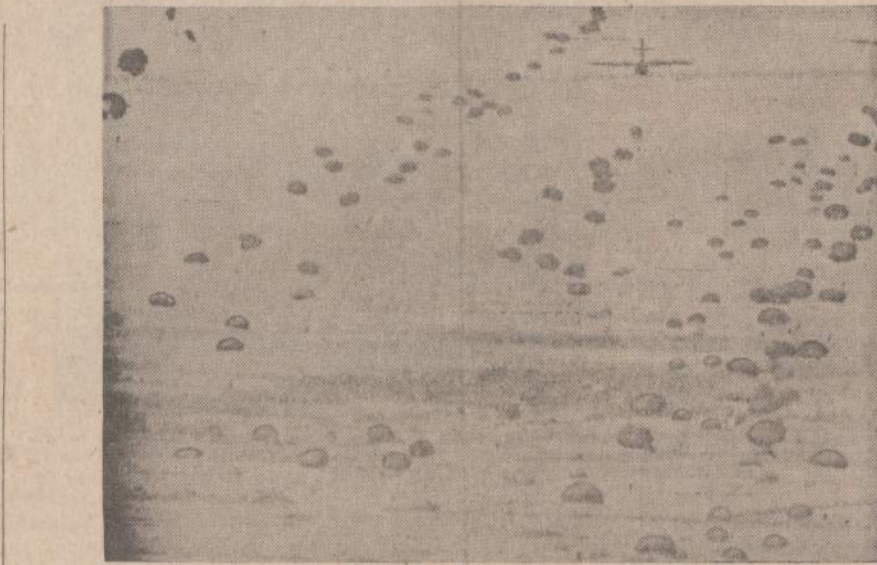
Vietnamo lėktuvai išmetė Vietnamo parašitūninkus Mekong upės įtakoje. Yra pagrindo manyti, kad nusileidusieji apvalys pakraščius nuo komunistų, kad karo laivai galėtų iškelti kelis JAV batalijonus.

Prieš tris savaites nuo teroristo kulku žuvo kitas asamblėjos narys, irgi žinomas vyriausybės reikalavimų priešas. Sklinda gandai, kad vyriausybė ir jį pašalino nuo savo kelio.