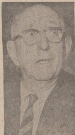
Senatorius Richard Russel ir atstovas L. Mendell Rivers reikalauja, kad būtų pavorota galinga JAV įega Vietnamo ir baigtas karas. Jiems atrodo, kad dabartinėmis priemonėmis karas labai ilgai užsitęs.

BRUSELIS. — Po dviejų metų tarpusavio kovų Belgijos socialinio draudimo įstaiga susitarė su Belgijos gydytojų sąjunga, kuri streikavo ir boikotavo draudimo įstaigą, reikalaujama didesnių atlyginimų.