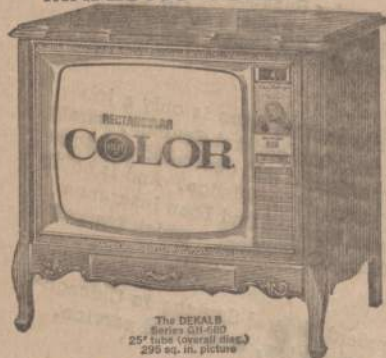
The DEKAL Series 511-500 25" tube (overall size) 20 1/2" sq. in. picture