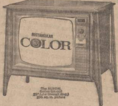
The HURDLE Series 511-500 25" tube (overall size) 20 1/2" sq. in. picture