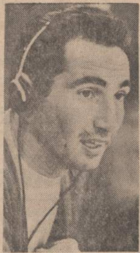
Sportininkas Sandy Koufax daugiau nebeaidžia, bet jis pasirašė vieno milijono dolerių sutartį su kino filmus gaminančia bendrove.

Reikia stebėtis, kaip knygos autoriai drįsta taip slėkščiai meluoti skaitytojui, juoba, kad dar daug skaitytojų tebėra gyvi ir prisimena Nepriklausomybės laikus. Bendrai suglaudus, didžioji šios knygos dalis yra skirta Nepriklausomos Lietuvos šmeižimui ir suniekinimui, griebiantis niekuo nepagrįsto melo. Taip pvz., 76 psl. tvirtinama: "Didelė dalis Kaune veikusiu leidyklų ir knygynų spausdino ir platino daugiausia religinę arba pornografinę literatūrą". Jei taip būtų meluojama Rusijos kalmukams ar Afrikos juoduoms, bet dabar gi — kultū-