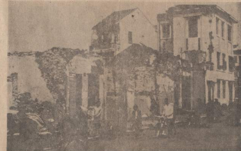
Komunistai paskelbė šį paveikslą tvirtindami, kad viena JAV bomba, numesta Hanoi mieste, sugriovė 13 namų ir užnužė 5 žmones. Paveiksle matomi nukentėję namai.

J. Pakalnio kūryba naudojama, mėgiama, tačiau jo kapas, pasirodo, ne tik užmirštas, bet ir išniekintas. Kas buvo tie „be sąžinės ir be padorumo jausmo“ išniekintojai, nebėra vilties išsiaiškinti: paprasti chuliganai, ar kerštingi „komunizmo statytojai“.