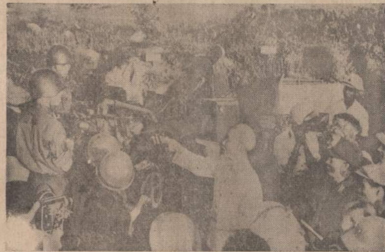
Šiaurės Vietnamo komunistų vadas Ho Chi Minh apžiūrinėja priešlėktuvinę patranką ir giria komunistus, išmokčius vartoti rusų atsiųstus ginklus.

stengiasi išlaikyti neutralumą. Surišta su JAV gynybos sutartimis, Nato sutartimi ir bendrais vienos hemisferos interesais, Kanada stengiasi atsiriboti nuo Amerikos politikos Vietnamo. Perna pirmą kartą Kanada nebalsavo kartu su Amerika prieš komunistinės Kinijos priemonę į Jungtines Tautas. Kanada siekia prekybos ryšių su Kinija, Kuba ir kitais Amerikos priešais. Tuo Kanada siekia pasidaryti nepriklausoma nuo Amerikos rinkų ir Amerikos įtakos. Neretai vadovauja Kanados politikai atvirai pasisako prieš Amerikos politiką užsienyje. Nežiūrint to, kasdieniniame Kanados gyvenime neįmanoma išsiversti be Amerikos kapitalo. Antrąjį šimtmetį pradėdama Kanada turi nemažai rūpesčių, tačiau jie yra pamirštami šių metų iškilmų akivaizdoje. Kanada su pasitikėjimu žvelgia į ateitį, nes ji valdo didžiulius, turtingus žemės plotus, trečdalis viso pasaulio gėlo vandens išteklių ir nesuskaitomus plotus miškų. Vis mažėjančiame pasaulyje Kanada ateityje gali suvaldyti svarbų vaidmenį.