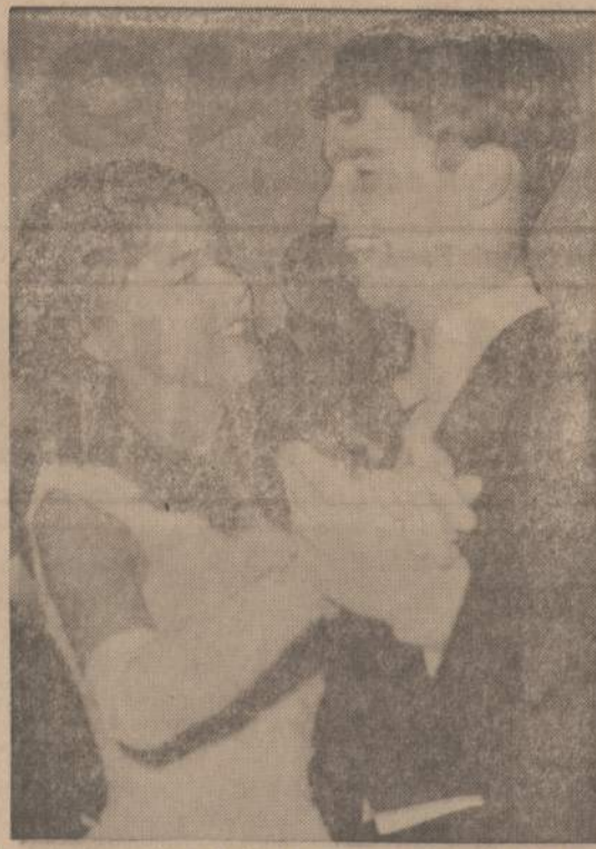
buvusio viceprezidento Richard Nixono 17 metų dukra Julie Nixon. Prezidento Eisenhowerio 18 metų anūkas David Eisenhower sėdintis su jiedu vienas kitą pažįsta jau išitsas dešimmetis.