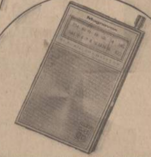
MAGNAVOX AM-FM POCKET TRANSISTOR — In a handsome leather carrying case this 11 transistor radio comes complete with a long life battery (125 hours) and "no drift" tuner which keeps stations "locked-in".

NEW HIGH RATE 4 3/4% ANTIOPATED RATE EFFECTIVE JANUARY 1, 1967 ON INVESTMENT SAVINGS ACCOUNTS