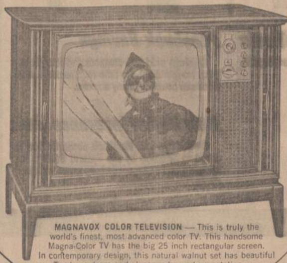
MAGNAVOX COLOR TELEVISION — This is truly the world's finest, most advanced color TV. This handsome Magna-Color TV has the big 25 inch rectangular screen. In contemporary design, this natural walnut set has beautiful Tambour doors and elegance beyond expectation... it's on display in our lobby.

A drawing for 7 grand prizes will be held on Saturday, January 28 at 12 o'clock noon. There is no contest to enter — no guessing, or time limits to write — anyone may enter. Simply stop in, fill out a registration card and place it in the grand prize drawing box. Winners need not be present at drawing — you will be notified by mail. Come in and register early.