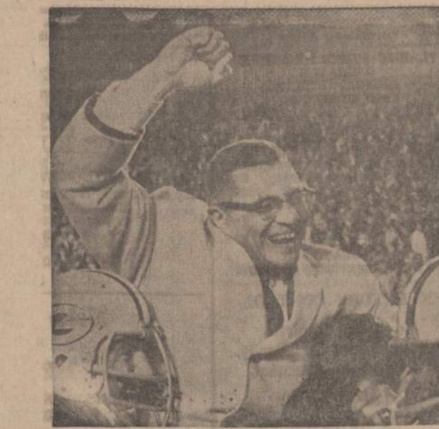
Green Bay Packers vadas Vince Lombardi nešamas ant pečių už vykusį Dallas futbolo komandos sumušimą. Sausio 15 dieną jie tikisi įveikti kitas komandas.

Chicagoje ir šiauriniame Ilinojuje gyvenantieji asmenys savo pajamų mokesčių