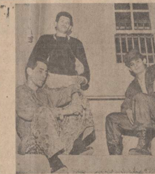
Trys jauni Kubos kariai sėdi Key West, Fla., kalėjime. Valdžia išsiškino, kad jie rengiasi apmokyti jaunuolius kovai pačioje Kuboje ir planevo sudaryti puolimo bazę Haiti respublikoje. JAV vyriausybė nenori, kad apmokymas vyktų JAV teritorijoje.

MIAMI. — Iš Kubos atvykę žmonės pasakoja, kad Kuboje irgi steigiamos jaunų revoliucionierių brigados, panašiai kaip Kinijoje. Jaunuoliai turėsia kovoti prieš chuliganizmą, disciplinos stoką ir netvarkingumą.