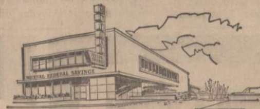
PARKING LOT — ADJOINING OUR OFFICE BUILDING

MOKA GERUS DIVIDENDUS. PRADEK TAUPYTI SIANDIEN!