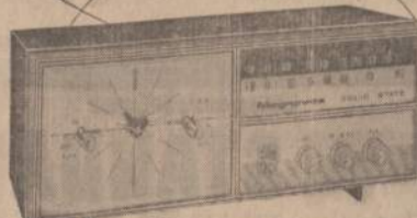
MAGNAVOX TABLE CLOCK RADIO — The Nocturne by Magnavox is AM or FM and has luminous hands for easy reading. Wakes you to music or wakes you to alarm. Has slumber switch too.

There will be coffee and refreshments served on Thursday night from 5 p.m. to 8 p.m., and during business hours on Saturday.