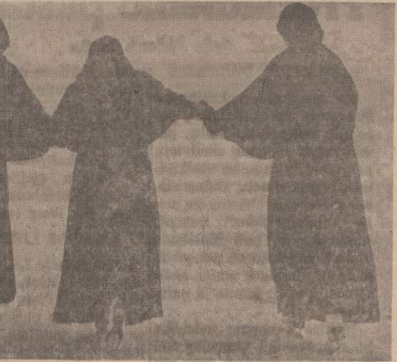
Mayville, Wis., vienuolės išėjo pačiužinėti Rock River ledą. Jos susikabino, kad kartais ledas nelužytų ir viena jų nepanertų.