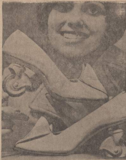
Italijos moterims jau gamina batukus su ratuku. Italės tokios nepastovios, kad ratukas padės joms lengviau pasisukti iš vienos vietos į kitą.

"Kokie Naujieji metai be šventiškai papuoštos eglutės! Labai gerai, kad ši naujametinė puošmena ateina į mūsų namus be žalos miškams. Gamtos apsaugos komitetas ir miškininkai šituo pasirūpino. Tačiau, deja, prekyba jomis nebuvo gerai organizuota. Neretai eglučių tekdavo laukti ištisomis valandomis. Dažnai