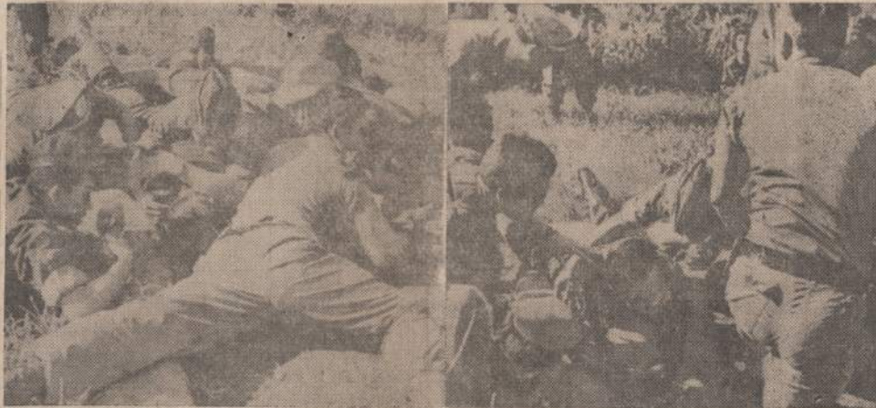
Vietnamo premjeras Ky nuvyko į frontą ir norėjo išbandyti australiečių vartojamą mortarą. Bet šoviny buvo sugedęs ir paleido liepsnas prieš laiką.

LUKSEMBURGAS. — Premjeras Pierre Werneris pranešė, kad Luksemburge bus panaikinta karinė prievolė. Ateityje kariuomenę sudarys 800 savanorių, reguliarių karių.