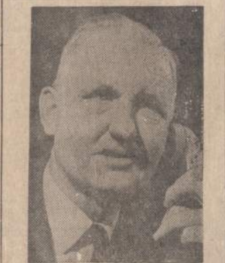
Atstovas Adam Clayton Powell neteko pirminkovo vietos apšviesto ir darbo komitete.

Trečiądienį Kennedžio pusiasalyje bus iššauti viena raketa trys satelitai, kurie taraus kariniam susižinojimui tarp Amerikos ir Vietnamo.