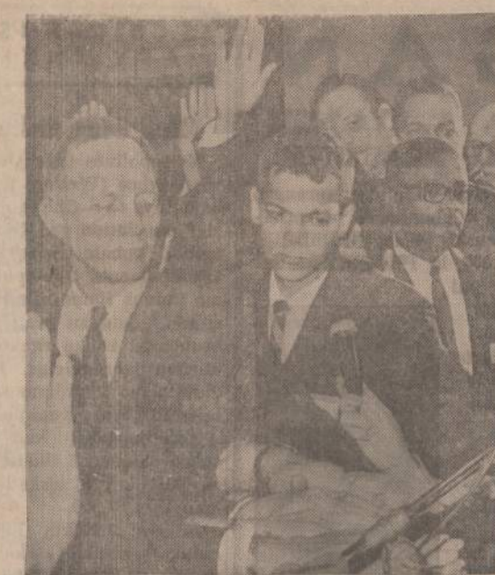
Georgia seimas nenorėjo išleisti negro Julian Bond dėl jo padarytų pareiškimų Vietnam karo reikalu. Vyriausias teismas įsakė Georgia seimui priimti išrinktą atstovą. Paveikslas viduryje matome Julian Bond, priimančį priesaiką kartu su kitais atstovais.