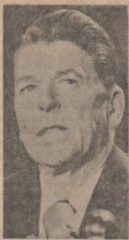
Ronald Reagan, Kalifornijos gubernatorius

Kitaip sakant, einama į kai kurių žmonių seniai siekiamą