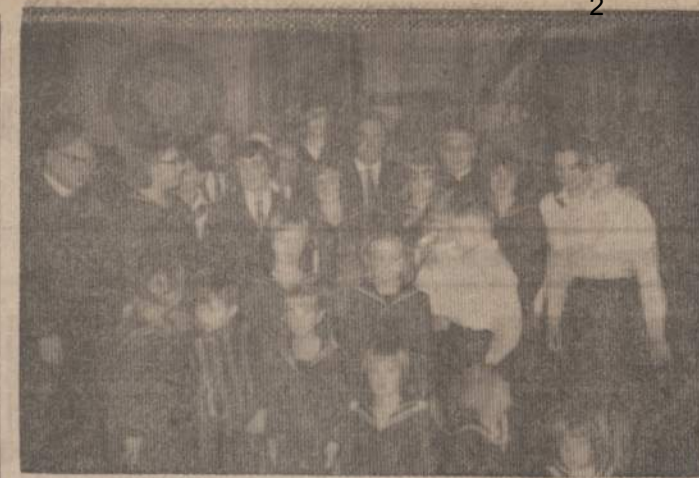
Naujasis Lietuvos Jūrų Skautijos Vienetas "TRAKAI" Lemonte su savo svečiais ir vadovais.

Tiesa, turėjome dar ir pasirodymą, dėl kurio visos labai jaudinėtės, nes jam pasiroditi laiko buvo nedaug. Tik dvi dienos. Bet kai pamatėme sesės Dalios paruoštus kostiumus, mūsų nuotaika tuoj pasitaisė, ir mes nutarėme kiek galint geriau viską atlikti. Tą ir darėme. Mat,