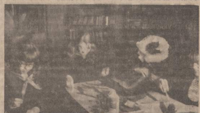
Glėbs didesnis už seses! Klaipėdos Uosto Mugės žydės, nes LJS Juodkrantės tunto sesės pavėrs pavarasiu Jaunimo Centru sausio 22 dieną.