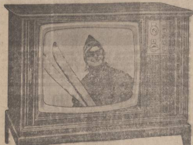
MAGNAVOX COLOR TELEVISION — This is truly the world's finest, most advanced color TV. This handsome Magna-Color TV has the big 25-inch rectangular screen. In contemporary design, this natural walnut set has beautiful Tambour doors and elegance beyond expectation... it's on display in our lobby.