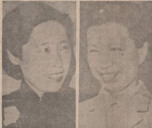
Tvirtinama, kad šios dvi moterys yra Kinijos neramumų prieštami. Kairėje yra Kinijos prezidento Liu Šaoči žmona, o dešinėje yra kvirtuoti komunistų vado Mao Cetungo žmona. Abi viena kitai pa-tydi valstybinės garbės ir aukštų titulu. Mao žmona kursto prieš prezidentienę.