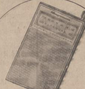
MAGNAVOX AM/FM POCKET TRANSISTOR — In a handsome leather carrying case this 11 transistor radio comes complete with a long life battery (125 hours) and "no drift" tuner which keeps stations "locked-in"!

There will be coffee and refreshments served on Thursday night from 5 p.m. to 8 p.m., and during business hours on Saturday.