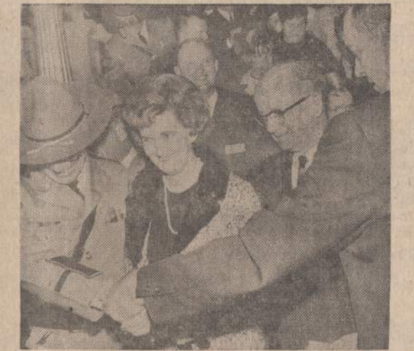
Naujai išrinktas Georgia gubernatorius Maddox su žmona priima prieraiką. Jis pareiškė, kad neeis kraštutiniams elementams kiūti valstybės reikalų tvarkymą. Jis griežtai pasisakė prieš negrus, bet jis yra pasiryžęs saugoti kiekvieno Georgia valstybės piliečio teises.

• Mekongo upės žemupy viet-namiečiai kareiviai užėmė buvu-sią komunistų kalėjimą. Pasi-traukdami komunistai žiuriai nužudė 44 savo kalinus. Seši iš-liko gyvi.