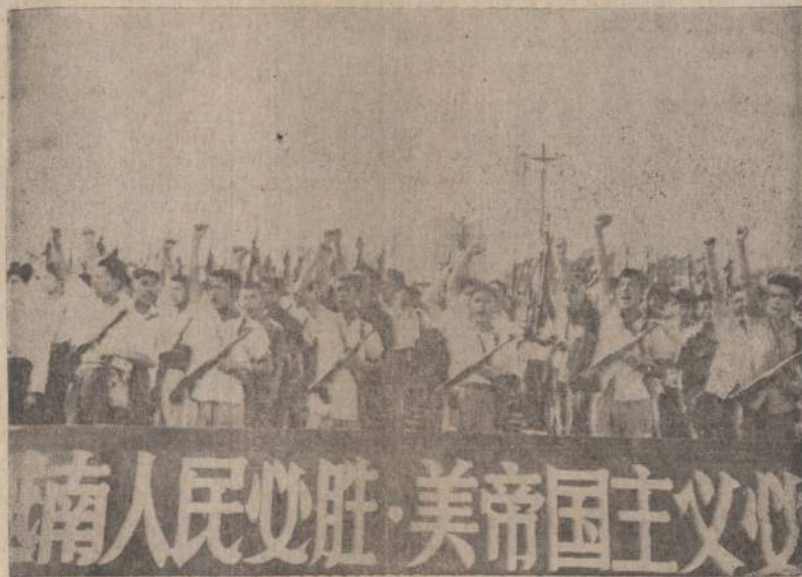
Komunistinė Kinijos valdžia skelbia, kad jaunimas nori vykti į Vietnamą ir padėti šiaurės komunistams užimti visą kraštą. Paveikslas rodo šūkiaučių ir rėkiaučių jaunimo maršą Pekine.

Valdinėje statistikoje rodomi tokie praėjusių metų derliai Lietuvoje: grūdinės kultūros — 14.7 ctn. iš ha., bulvių — 134 ctn., cukrinių runkelių — 209. Tik cukrinių runkelių derliai padidėję, palyginti su užpernykščiais. Kiti skaitmenys pernai statistikoje buvo didesni. Bet ir šie skaičiai didesni už nepriklausomybės laikų statistikos duomenyse turėtus. Nemažonus momentas šiame reikale, tačiau, yra tas, kad net patys tos statistikos sudarinėtojai neturi galimybės, nei drąsos tikrinti, koks skirtumas tarp tų statistikos įrašų ir tikrovės. (E)