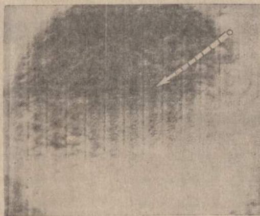
Naujai padaryta Mėnulio nuotrauka rodo, kad nufotografuotas akmuo savo laiku Mėnulyje judėjo. Jis paliko išpausta griovį, kaip matyti iš fotografijos. Kada tas judėjimas įvyko, mokslininkai nenustatė, bet šiandien kiekvienam aišku, kad akmuo nuo viršaus rito į pašlaitę.

TOKIJO. — Komunistinė Kinijos kariuomenės laikraštis pranešė, kad prezidentas Liu Shao Chi turis savo privačią kariuomenę, kuri yra nusistačiusi prieš Mao Tse Tungą. Ta kariuomenė ginanti valstybės diktatūrą, kai visa Kinijos kariuomenės masė esanti už pirmininką Mao ir Liaudies interesus.