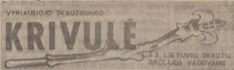
Vyriausio Skautininko biuletenio antraštinė vinjetė.

lius, siūdomos pajacius ir t. t. Kartu dirbant, greit prabėga laikas, ir daugiau nuveikiama.