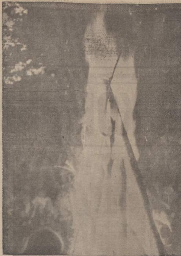
"LAUŽAS DEGA, AIŠKIAI SVIEČIA, KYLA KIBIRKŠTYS AUKŠTAI..."

Tėvams: — būti dideliais idealistais, tikint, kad skautų organizacija vaikus išmokys gerai lietuviškai kalbėti, rašyti ir skaityti... Laužo Liepsnelė