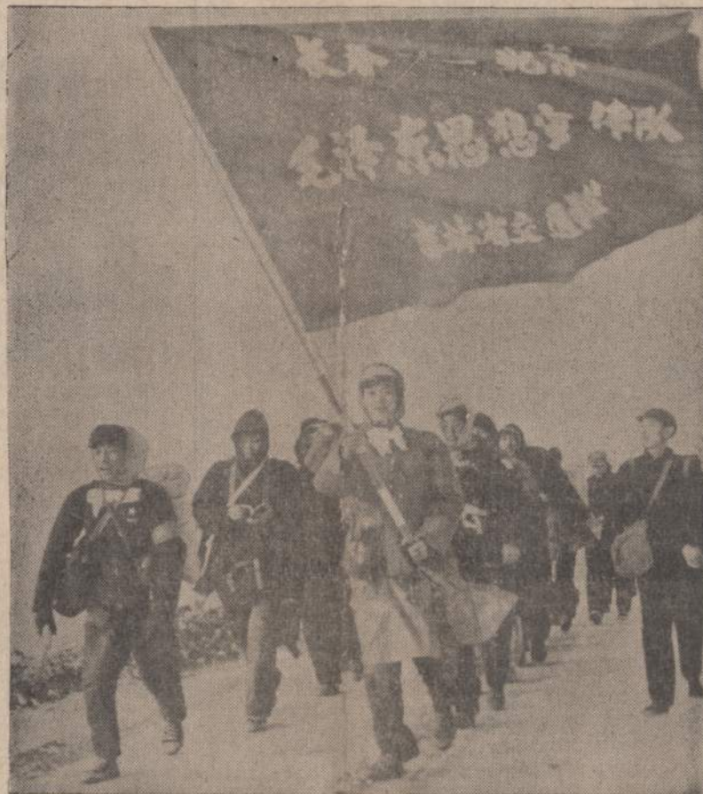
Komunistinės Kinijos kovose dėl valdžios didelį vaidmenį vaidina vadinamieji chunveinai. Uždarus vieniems metams visas mokyklas, studentai žygiuoja iš miesto į miestą, skleidami partijos pirmininko Mao Tse Tungo idėjas. Paveikslė viena tokia grupė transporto mokyklos žygiuoja dainuodami į sostinę Pekinę

— Vakar JAV į erdves buvo iššauti trys kariniai satelitai.