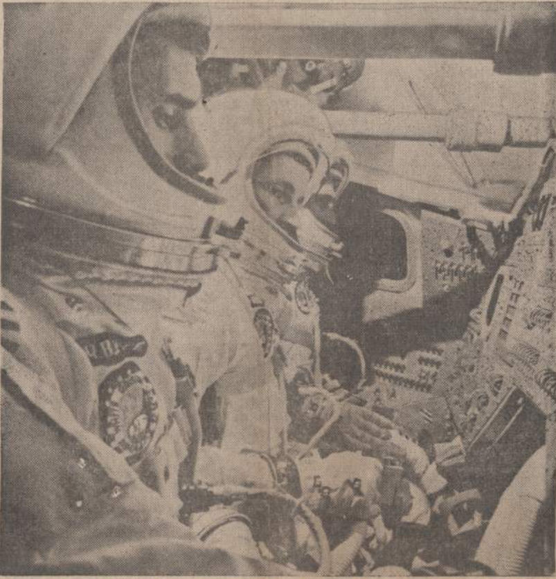
Astronautai Roger Chaffee, Edward White ir Virgil Grissom bando Apollo 1, kuris turės juos iškelti į erdvę tolimesniems tyrinėjimams. Jie tyrinės kelius, kaip galima saugiau pasiekti Mėnulį.

BANGKOKAS. — Austrijos prezidentas Franzas Jonas atvyko į Tailandiją 10 dienų vizito.