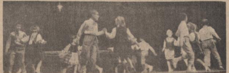
Mokyt. L. Cepaitytės paruošti, Kr. Donelaičio 3-io skyriaus mokiniai šoka "Kalvelį" Kalėdų eglutės metu, š. m. gruodžio 17 d. Jaunimo Centre

— Piešk metų laiko, tai parduosi per vieną dieną.