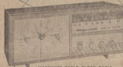
MAGNAVOX TABLE CLOCK RADIO — The Nocturne by Magnavox is AM or FM and has luminous hands for easy reading. Wakes you to music or wakes you to alarm. Has slumber switch too.