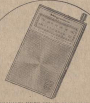
MAGNAVOX AM/FM POCKET TRANSISTOR — In a handsome leather carrying case this 11 transistor radio comes complete with a long life battery (125 hours) and "no drift" tuner which keeps stations "locked-in".

There will be coffee and refreshments served on Thursday night from 5 p.m. to 8 p.m., and during business hours on Saturday.