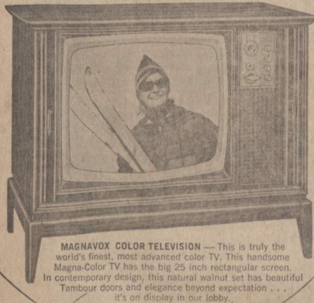
MAGNAVOX COLOR TELEVISION — This is truly the world's finest, most advanced color TV. This handsome Magna-Color TV has the big 25 inch rectangular screen. In contemporary design, this natural walnut set has beautiful Tambour doors and elegance beyond expectation... it's on display in our lobby.

A drawing for 7 grand prizes will be held on Saturday, January 28 at 12 o'clock noon. There is no contest to enter — no guessing, or limericks to write — anyone may enter. Simply stop in, fill out a registration card and place it in the grand prize drawing box. Winners need not be present at drawing — you will be notified by mail. Come in and register early.