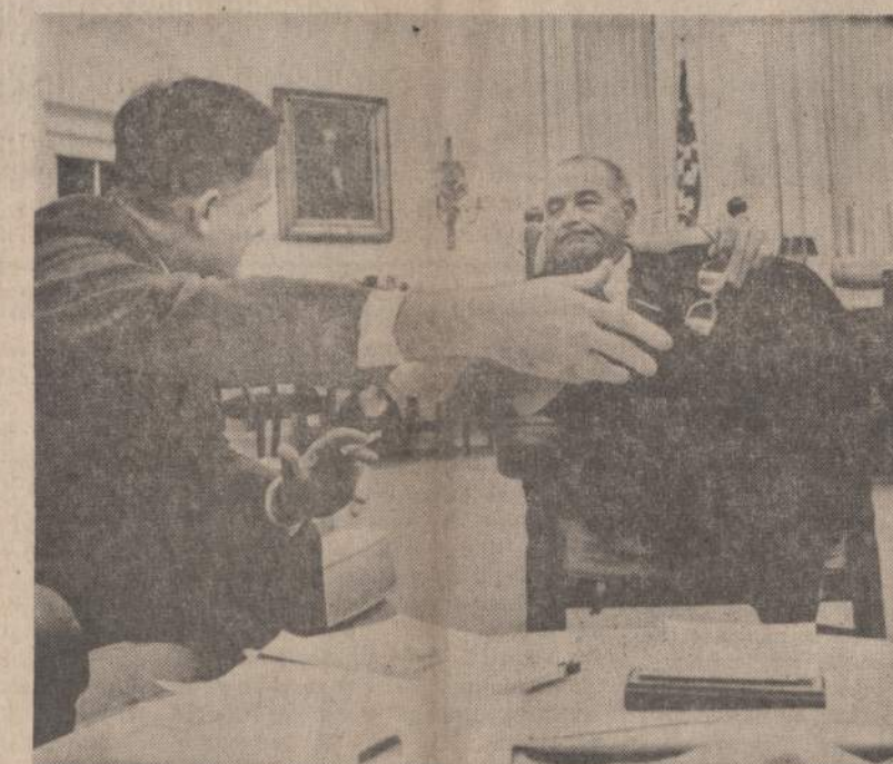
Prezidentas Johnsonas kalbasi su biudžeto direktorium Charles Schultze. Paruoštas biudžetas siekia 172 milijonus dolerių. 73 milijonai paskirti krašto apsaugai.

Kadangi nebeliko laiko jokioms diskusijoms, ir padėtis reikalauja labai greitų akcijų, ALT Clevelando skyrius ragina visus lietuvius skubiai rašyti JAV Senato nariams, prašant juos balsuoti prieš konsularinės sutarties tvirtinimą. Pati pirmutinė akcija turi būti nukreipta į Užsienio Santykių Komitetą, pro kurį sutartis turi praieiti prieš jos pateikimą senato plenumui. Po komiteto patvirtinimo reikia kontaktuoti visus senatorius (žiūrint į šį reikalą iš praktiškos pusės, mes neturime vilties atvesti sutartį pačiame komitete, nes vyriausybė turi labai aiškią persvarą. Visas pasipriešinimas įvyks Senato pilnatinės debatuose, kur opozicijos jėgos bus stipresnės. Kadangi tie patys senatoriai dalyvaus ir Senato plenumo, pirmutiniai laiškai yra rašytini Užsienio Santykių Komiteto nariams).