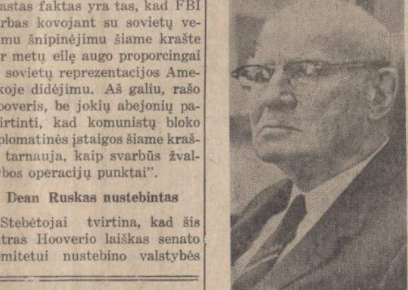
New Yorko stovas Emanuel Celler vadovaus komisijai, kuriai pavesta iširti visa stovs Adams Clayton Powell eigenė stovų rūmų komitete ir gyvenime.

NEW YORKO STOVAS Emanuel Celler vadovaus komisijai, kuriai pavesta iširti visa stovs Adams Clayton Powell eigenė stovų rūmų komitete ir gyvenime.