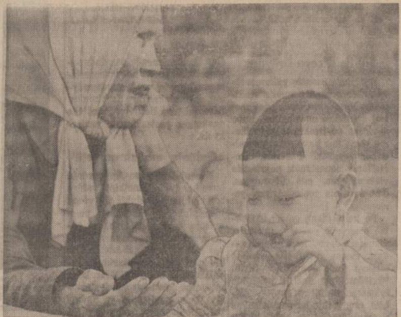
Vietnamo ir JAV karo jėgos išvarė gyventojus ir sunaikino Saigono upės pakraščius buvusį kaimelį, kurį komunistai naudojo įsiveržimams į Saigoną. Moteris su kūdikiu turi keliauti į stovyklą

SKAITYK PATS IR PARAGINK KITOS SKAITYTI NAUJIENAS