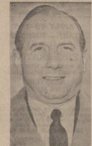
Makleris Bobby Baker, besisukinėdamas tarp įtakingų politikierių, pasidarė daug peino, nemokėjo valstybes mokesčių ir emė kyšius. Jis pripažintas kaltu ir laukia bausmės. Jam teks ilgus metus sėdėti kalėjime.