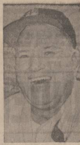
Geriausias Mississippi beisbolininkas Jerome Dean pareiškė, kad jis kandidatuos į gubernatorių.

— Jūs laimingas, — pastebėjo savininkas. — Stebiuosi, kaip jie tavęs neužmušė..