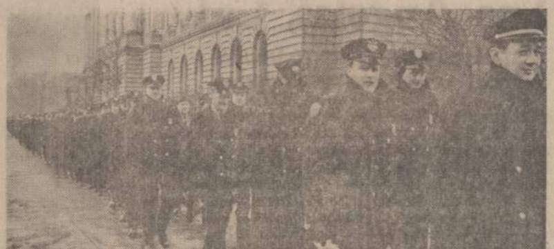
Clevelando policininkai ir gaisrininkai piketuoją miesto savivaldybės rūmus, kai vadovybė atsisakė pakelti jiems algas.