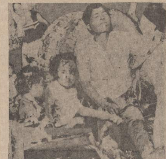
Filipinų salose du busai nukrito nuo kalno, užmušdami 115 vaikų ir suaugusių. Antrojo buso stabdžiai buvo blogi. Antrasis busas trenkė į pirmąjį, o vėliau abu nukrito. Matome nelaimės vaizdą.

HOURS Mon., Thurs. 9-8/Tues., Fri. 9-4 Sat. 9-12/Wed. Closed