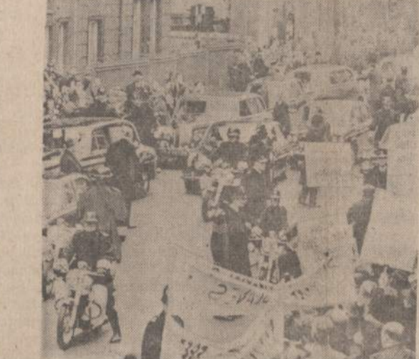
Aleksai Kosyginui labai nepatiko, kai Londone jį pasitiko demonstrantai ukrainiečiai. Jie reikalauja, kad Sovietų Sąjunga nesiegtų taip žiauriai su Ukrainos gyventojais, neskriaustu jų ir duoty jiems daugiau laisvės.

Todėl Amerikos politikos planavimas Artimuose Rytuose priklauso atskiriems ambasadoriams.