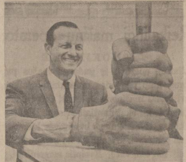
St. Louis mieste pastatytas paminklas naujam vadovui Stan Musial. Tvirtinama, kad jo rankos labai stiprios, todėl jam ir paminklą tokį pastatė.

piliečių ir rezidentų artimųjų (Aukščiausias teismas) pasis- tengia, kad sunkiau ir sunkiau kriminalistą benuteisti, ir kri- minalo statistika baugiai kyla aukštyn.