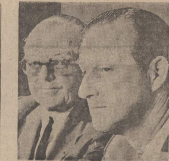
St. Louis Cardinals savininkas August Busch kalbasi su nauju šios sportininkų grupės vadovu Stan Musial.

Pirmininko pranešime jis dėstė, jog kredito kooperatyvui augti neleidžia Kalifornijos įstatymas, varžantis kredito unijų laisvę duoti neribotas nekilojamo turto paskolas. Buvę daromi žygiai įstatymą pakeisti, bet buvęs gubernatorius (Brown, demokratas) tų žygių nepatvirtinęs. Kredito unijų sąjunga dabar vėl veikia, kad naujasis gubernatorius (Reagan, respublikonas)