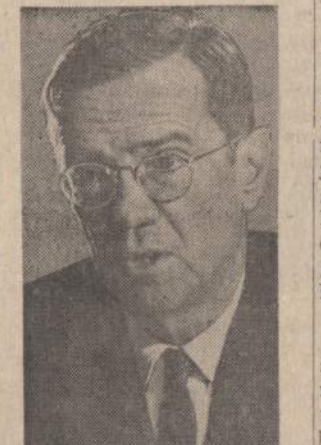
William McChesney Martin Jr., Federalinio Rezervo Banko pirmininkas, tvirtina, kad nuosimčių negalės sumažinti, jeigu valdžia nesumažins išleidimų arba nepadidins mokesčių.

JAKARTA, Indonezija. — Čia gautomis žiniomis, šiaurinės Sumatros sostinėje Medan prasidėjo kruvinai susirėmimai tarp priešiški prezidentui Sukarno nusistačiusių studentų ir Indonezijos nacionalistų partijos jaunuolių, kurie yra Sukarno šalininkai.