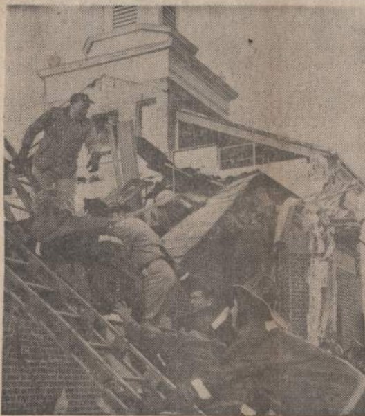
Baltimorės katalikų bažnyčios stogas neatlaikė iškritusio sniego ir lūžo. Buvo sužeisti keli vaikai, bet nei vienas neužmuštas.

TOKIO. — Didžiausias miestas pasaulyje praėitą savaitgalį turėjo sniego audrą, kokios nebūterėjo per 13 metų. Pasmigo iki 5 colių. Tarptautinis aerodromas pirmą kartą per 6 metus buvo uždarytas.