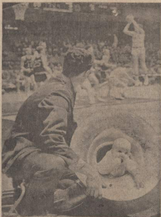
Manhattan kolegijos studentas savo dukra įkišo į pučiamojo instrumento — bosu vamzdį, kad galėtų sekti jo mėgiamus sportininkus.