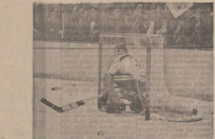
Bostono hockey žaidėjas nesilalkė taisyklių New Yorke. Žiūrovai jį apvilpė ir paleido kelis pagalius. Jam teko pasislėpti po tinklu.

vė dar ir pavadinimą: "Dziunglės". Sugadino gerą sekrdyklų vardą, sudirbo, subauriojo jas visai ir tas jo romanas sukėlė viešą skandalą Amerikoje. Tikrai tai buvo gudrus vyrukas, na, ir laimingą gerą turėjo. Niekas o niekas nė sprando nenusuko. Matyti, niekas, kam reikėjo, nežinojo, nė nežinodė, o gal dėl to, kad tarp mūsų jaunų vyrų suklinėjosi. Stotyje maišėsi daug žmonių. Vieni atėdavo išvažinoti, kiti išėdavo į miestą iš kur nors katur atsidanginę į Chicago. Vis girdėjosi duslus besistumdančių garvežių sirenų maurojimas, o kai atsiduodavo pakildavo juodų dūmų debesys su kibirkštimis, lyg iš pačio velnio nasrų, besivejančio berną nuo mergų kamaros... Greit vėl atėjo kitas traukinys. Vėl sunkiai atsiduro ir išitiesė prie stoties pastatų kaip žvilgantis žaltys pavasario saulės sniegą nutirpdytų. Iš vagonų ritiesi kaip vabalai atvažiavę keleiviai. Dauguma jų buvo iš Europos atvažiavę imigrantai. Juos tada buvo galima lengvai atpažinti. Visi turėjo ant pečių maišus, kuriuose, kaip paprastai, tūpo ne tik naujo atėivio visa manta, bet ir dovanos giminėms: džiovinti sūriai, rūkytas kumpis, sausas dešra... Jų veiduose visai nesimatė šypsenos. Išvargę, apsiblausę, susimastę, susirūpinę. Tik su atėjusiais jų pasitiktį artimaisiais išsibėgavę, nubėgę džiaugsmo ašaras, pakeldavo aukščiau galvą. Dangus tuo metu blaivisė. Sklaidėsi rū-