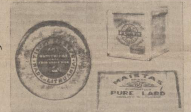
Nepriklausomos Lietuvos pramonės gaminiai eksportui su angliškais įrašais (iš neseniai Liet. Skautų Brolijos išleisto knygos "Pirmo patyrimo laipsnio skautas").