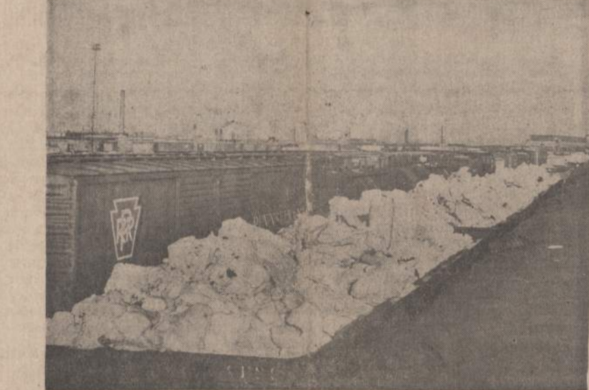
Chicago geležinkeliečiai, nežinodami kur dėti iškritusį sniegą, sukrovė jį į vagonus ir siunčia į piešus. Kol vagonai pasieks Texas, tai sniegas ištirps.

Dabartinę Kekkoku šventę vasario 11 dieną įvedė premjeras Eisaku Sato, pasiremdamas tam tikros civilinės tarybos šešių prieš tris balsus priimta rekomendacija tokią šventę steigti vasario 11 dieną.