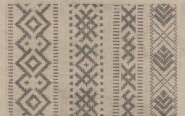
Ilustracija iš knygos "Pirmo patyrimo laipsnio skautas".

(Iš knygos "Pirmo patyrimo laipsnio skautas", kurią neseniai išleido Liet. Skautų Brolija)