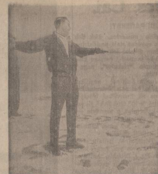
Golfo mėgėjas išdžia prie įvairiausio oro, bet kai pradėjo snigti Georgia valstijoje, tai turėjo viską mesti.

Nemažas straipsnis apie Mikolaičiką yra Liet. Enc. je. Daug apie jį parašyta Naujienose 1966 m. Paskutinė informacija apie jį Naujienų 1967. 1.7 ir 1967. 1.14, II dalyje "Valstiečio tradicija". J. Kaunas