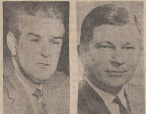
Texas demokratai kritikuoja Manchesterio knygą apie prezidento Kennedy nužudymą. Gubernatorius John Connally sako, kad knygoje labai daug melo. Jis pats pasiryžęs parašyti kitą knygą. Rep. sen. John Tower tvirtina, kad knygoje yra daug melo, zominančio Texas gyventojų charakterį.

ZENEVA. — Sveicarijos vyriausybė pranešė Jungtinėms Tautoms, kad ji nepritaria Rodezijai paskelbtoms sankcijoms ir ekonominei blokadai ir Sveicarija, kaip neutrali valstybė, prieš sutartį nepripasidės.