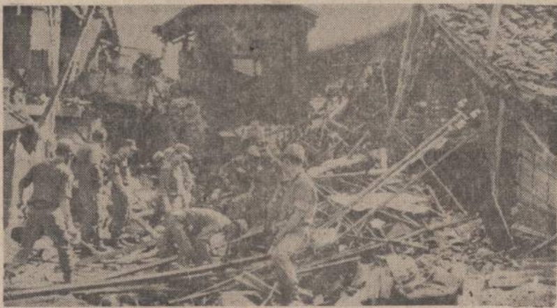
Komunistai įsinešė mortara į vieną Saigono priemiesčių namelį, iš kurio bandė apšaudyti gen. Westmorlando štabą, bet jiems nepasisekė. Vėliau sprogo namelyje pastatyta bomba, kuri užmu- šė visus įsiveržėlius. Vietnamo kariai tyrinėja sugriauto namo lauzą.

Komunikate pranešama, kad "Jos Didybės vyriausybė sumo- kės sovietų vyriausybei 500,000 svarų sterlingų sumą iš tų lėšų, kurios laikomos Jungtinėje Ka- ralystėje". Sovietų vyriausybė sutinka šią sumą priimti britų gaminių pavidalu. Susitarimas dėl šių dalykų bus suformuluo- tas netolimoje ateityje.