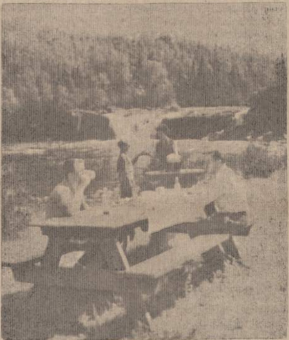
Važiuojant į Expo-67 pasistiprinti Transkanados paplentės parkelyje Gamtovaizdis vienas iš daugybės panašių ir kitokių. Transkanados plentas per Ontario provincijos teritoriją yra išvestas tokiomis vietomis, kur prieš keletą metų dar baltos žmogaus kojos nebuvo įžengusi. Gamtovaizdžiai yra neapsakoma gražumo.

Ar pastebėjote, kad daugumas žmonių, gimdymų kontrolės šalininkų, patys jau yra gimę.