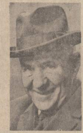
Sovietų premjeras Aleksej Kosygin 6 dienas tarėsi su britų premjeru Wil- sonu Vietnamo taikos reikalui, bet nepavyko susitarti. Prezidentas John- sonas, netekęs kantrybės, įsakė avia- cijai bombarduoti šiaurės karo cen- trus.