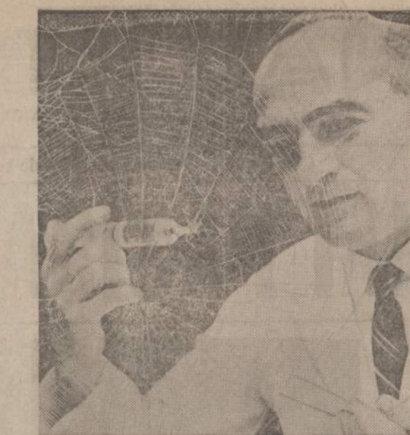
Voras, gavęs nesusivaldančių jaunuolių mėgiama chemiatą LSD, audžia žymiai didesnę tinklą. Gavęs kitokių vaistų, jis audžia ketrkampį tinklą. Meksikiniai dabar tyrinėja, kaip vaikų vartojami vaistai veikia vorus ir įvairius vabalus.

Praėjo beveik metai. Kas rašė, nepaaiškėjo... Užtat netrukus iškilo aikštėn kas kita. Per draugišką teismą, kai buvo svarsto-