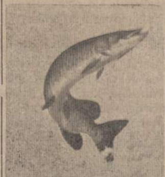
Kaip kleva lapas, taip lyds muskelingas dėl savo gausumo ir gražumo abudu tikty į Kanados tautinę vėliava.

Iš Čikagos į Montrealį yra keturi būdai patekti: automobiliu 850 mylių, kiek ilgai kelionė truks, priklauso nuo vairavimo. Geležinkeliu važiuoti trunka 19 valandų. Autobusu 18 valandų, o lėktuvu 2 valandas. Yra keturios oro linijos — Air Canada, B. O. A. C., Air France ir Alitalia. Kelionė į abu galu lėktuvu nuo $96 iki $142. Greyhound autobusu taip pat į abu galu $50.60; Canadian National Railway geležinkeliu nuo $41.80 iki $54.60.