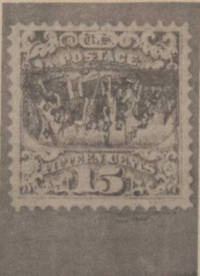
Pablo Picasso atidavė gulničius ir knygą skaitančios moters paveikslą (kairėje). Varžytinėse už jį sumokėjo $105,000. Už dešinėje matomą pašto ženklą sumokėjo $35,000. Kolumbo atvykimas atspausdintas aukštyn kojom. Yra tik trys tokie ženklai.