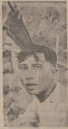
Da Nango laukuose nelaisvėn paimtas komunistas turi aiškinti, kas ir kur jį siuntė į pietų Vietnamą. Prie jo kaktos pristatytas komunistų pagavusio kario šauluvas.