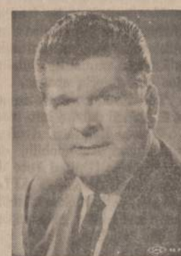
Aktyvus ir dinamiškas