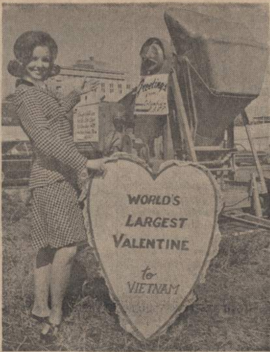
Vietname esantieji kariai labiausiai norėjo gauti mašiną cementui maišyti, kad galėtų pasidaryti gerus apkalus. Tokia mašina jie gaus. Columbia, S. C., gyventojai jiems siūnčia tokia mašiną. Viskas eis į Vietnamą, kas matosi paveiksle, išskyrus gražią merginą, o jos kariai labiausiai norėtų.

Automobilių darbininkų unijos (UAW) pasitraukimas iš darbininkų federacijos (AFL-CIO) būtų didžiausias nuostolis