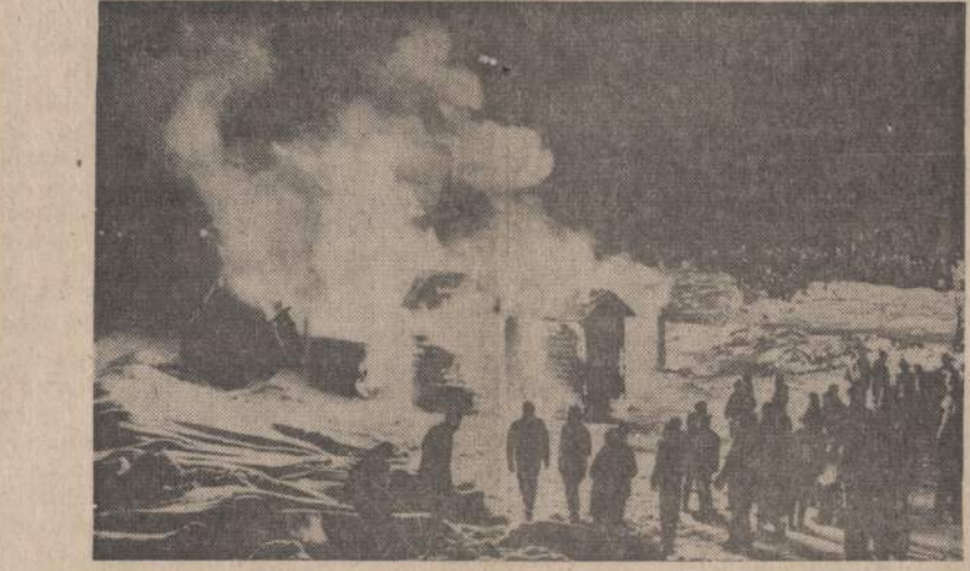
Manitobos gyventojai paveiksle matomu būdu paminėjo Kanados šimto metų sukaktį. Kai Bowman, Man., miestelyje įvedė vandentekį, tai taip pat buvo padegtas namas. Visi suėjo pasižiūrėti degančio seno namo.

Teismo salėje trys eilės pirmųjų suolų bus paskirtos spaudai. Iš salės išėiti, ar į ją įeiti bus galima tik per teismo pertraukas.