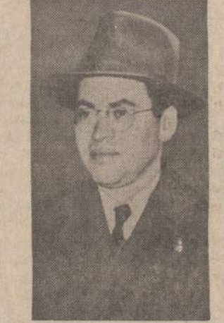
Sovietų žnipas Martin Sobell, nuteistas 1951 metais, prieš teismą dar kartą peržiūrėti jo byla. Sako, kad liudytojai neteisingai liudiję. New Yorko teismas atmetė Sobello prašymą. Jo bendradarbiai Julius ir Ethel Rosenberg buvo nuteisti mirti.

DAYTONAS, Ohio. — JAV karo aviacijos įstaiga, kuri rūpinasi "nežinomų skraidančių objektų" aiškinimu, paskelbė, kad per praėjusius metus ji gavo 1,060 pranešimų apie įvairias "skraidančias lėkstes". Tik 30 iš to skaičiaus nebuvo patenkinamai išaiškinti. Aiškinti vėdami jau 20 metų. Per metus įstaiga gauna vidurkį 555 pranešimus.