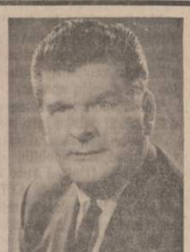
Aktyvus ir dinamiškas