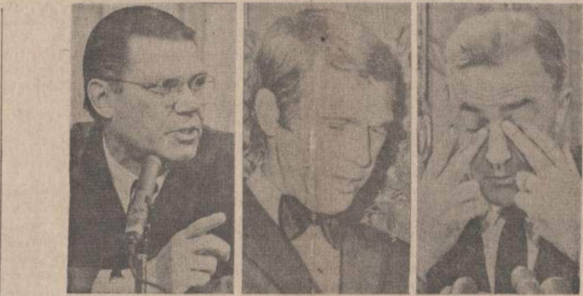
JAV krašto apsaugos sekretorius Robert McNamara lūdi JAV senato komitetui apie apsaugas prieš raketas. Viduryje artistas Steve McQueen gavo užsienio spaudos geriausio vaidintojo pažymėjimą. Dešinėje sen. McCarthy reikalauja ištirti studentams teikiamas pašalpas

tys filialo paruoštas konjungtūros apžvalgas bei kitą tyrimo medžiagą, o taip pat pasiūlymus dėl mokslinio tyrimo darbo planų". Atseit, kadangi pirkėjai parduotuvėse neranda ieškomų prekių, tai steigama tarnyba, kuri svarstys pasiūlymus, pagal kokį planą mokslininkai tirti, kodėl neranda... Tai vienas iš būdingiausių pavyzdžių, kaip Lietuvą užgrobusi Rusijos komunistų partija ir valdžia "didžiai atsidėjusi rūpinasi Lietuvos darbo žmonių buities gerinimu". (E)