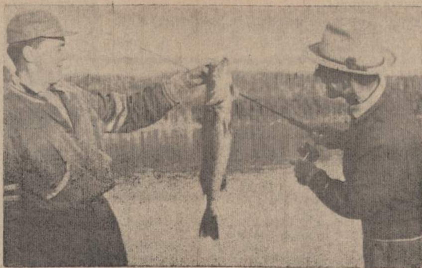
Laimikis nemažas, bet tas pats didysis, kaip paprastai yra, pabėgo! Dažnai matomi vaizdai Kanados paupiuose ir pažeistose.

"Šiandien miestų svarbiausias uždavinys yra žmonėms suteikti kultūrą, idėjoms ir švietimui mokslu apsieikti". Dabar žmogaus kasdieninė darbovietė yra nukeliami toliau ir toliau į užmiesčius ir jis pats darbovietėje daug mažiau laiko bepraleidžia."