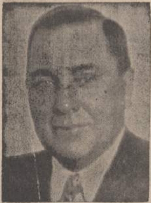
Richard Daley, Čikagos miesto meras

kadangi Čikagos Lietuvių bendruomenė, stovėdama laisvės siekėjų priekyje niekada nesumažino savo pastangų atgauti pavergtą Lietuvos gyventojų laisvės ir nepriklausomybės, todėl, aš, Richard J. Daley, Čikagos miesto meras šiuo raginu Čikagos gyventojus niekada nesumažinti tos paramos, kurią mūsų miestas visada teikė tiems, kurie kovojo dėl tos mažos, narsios tautos laisvės; tautos, kuri davė mūsų miestui tūkstančius savo sūnų ir dukterų, kurie tapo gerbiaimais mūsų visuomenės piliečiais. Raginu šią vasario 16 dieną kreiptis į savo atstovus kongrese, kad jie griebtųsi veiksmų, ir atkreiptų dėmesį į tų bejėgių komunizmo vergų kančias.