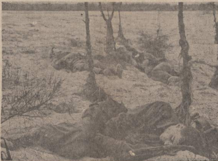
Tai ne Ritz viešbučio patogumai. Bet trys JAV marinai jaučiasi patenkinti, gavę progą, palyginti minkštos vietos, keletą minučių pamiegoti. Vieti artli Hoi An, Pietų Vietname.

Bet ir tą neva pritrėnkiantį palyginimą suniekina ką tik pateiktoji statistika, kadangi skirtumas tarp lietuvių padėties Amerikoje ir rusų padėties Lietuvoje per daug akivaizdus. Lietuvių Amerikoje vos vos apie