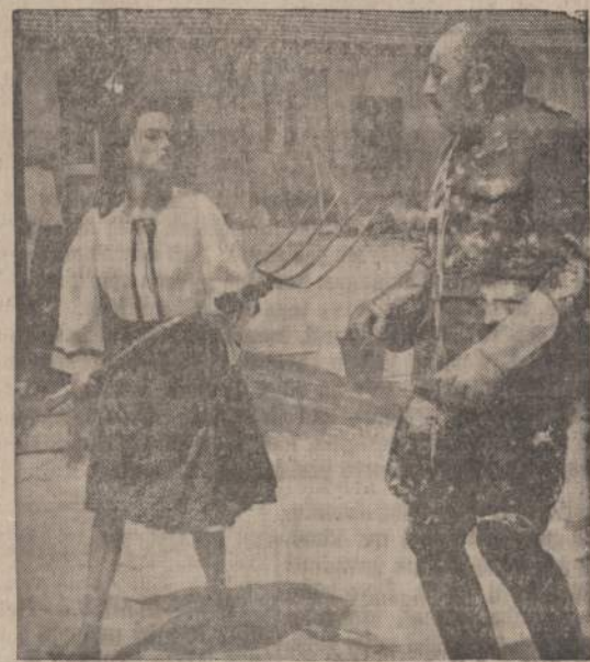
NAUJAS CARLO PONTI FILMAS

Sąjunga. Ši siena pagal Mas-kvos valią šiandien yra gero-kai pastūmėta į Lietuvos pu-rą, pradedant rytuose Breslau-jos, Vidžių, Lentupio, Kamo-jų, Gervėčių, Ašmenos, Lydos ir Gardino žemės plotais, ku-rie priskirti prie Gudijos ir baigiant pietuose Augustavo, Seinų ir Suvalkų žemės plotais, priskirtais prie Lenkijos. Gal šis Sovietų Sąjungos savavališ-kas politinės sienos pakeiti-mas ir neturi tarptautinės ga- (Nukelta į 3 psl.)