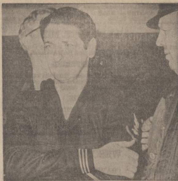
Prisipažinęs Bostono moterų smaugikas Albert DeSalvo buvo laikomas Bridgewater ligoninėje, bet iš ten jam pavyko pasprukti.

Lietuvių kalba: kasdien nuo pirmadienio iki penktadienio 10-11 val. ryto. — Šeštadienį ir sekmadienį nuo 8:30 iki 9:30 val. ryto.