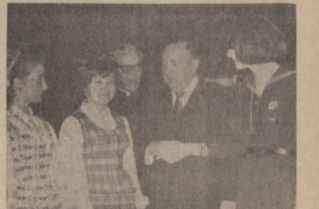
Chicago mieras Richard J. Daley Vasario 16-tos dienos sukakties minėjime Chicago lietuviams pareiškė, kad jis nemėgsta komunistų ir jų valstybę, kurios pavergia kitas tautas, bet jam labai patinka lietuviškas. Pavoisklė mirtome Chicago mieras minėjime su dalyvausiu lietuvių grupė.

Bendrai visi trys minėjimai praėjo darniai, nusisekusiai ir pakiliai, suteikdami didelio malonumo patiems lietuviškams mokiniams ir jų sesutėms bei broliukams ir draugams, o ypač jų tėvams ir bendrai lietuviams, kad gerų žmonių pastangų ir mokytojų pasišventimo dėka mūsų lietuviškasis atžalynas kad ir ne didelis, bet sveikas, gražus ir vešliai bujoja. Abu tėvai