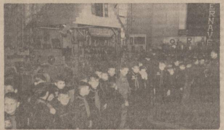
LIETUVISKAS ATZALYNAS PRIE KAZIUKO MUGE

Published as a public service in cooperation with The Advertising Council and the International Newspaper Advertising Executives.