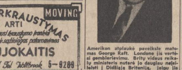
Amerikon atplaukė pavelksle motas George Raff. Londone jis vertėsi gembleriaivimu. Britų vidaus reikalų ministeris nutarė jo daugiau nusiųsti į Didžiąją Britaniją, jeigu jis kada nuturtų atvažiuoti.

Illinojaus kelių departamentas žada nuo šio trečiadienio pradėti paplėncių ir šalikelių valymą. Tam darbai departamentas turįs 180 mašinų ir 100 žmonių personalą. Valymo darbas truksias pora mėnesių ir kaštuosias daugiau kaip $650,000. Už pakelių teršimą yra nustatyta $50 bauda, už trečią nusikaltimą $300, tik departamentas neskelbia, ar daug iš to pelnė.