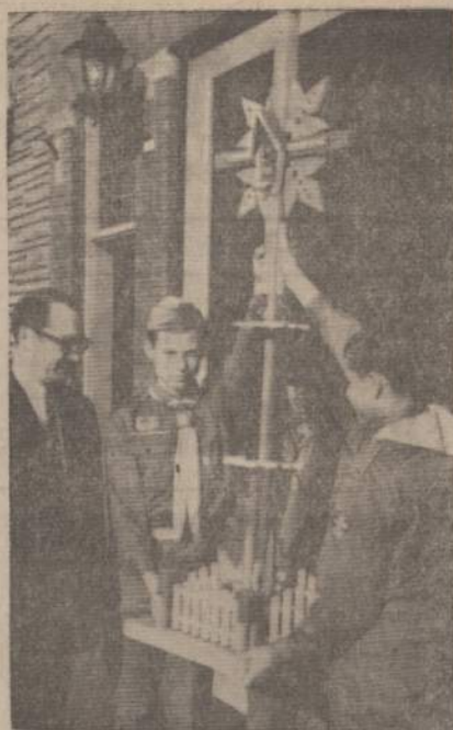
DOVANA KULTŪROS MUZIEJUIJ

Sekandiamame kambaryje brolis Trinkūnas sušilęs lipo Vytautų laikų karvedžio mozaiką. Su teptukais čia lieja dažus ir trys sesės talkininkės su Brolijos vyriausia valdžia s. V. Vijeikiu priešakyje. — Ar pats čia tą baudžiavą