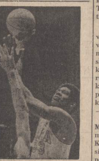
Kalifornijos Universiteto studentas Lew Alcindor skaitosi geriausias krepšininikas.