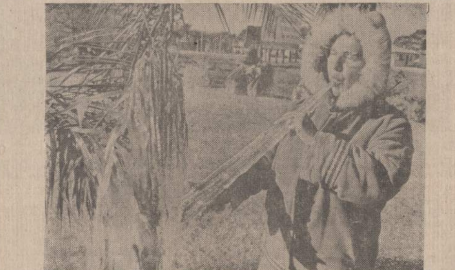
St. Petersburg, Fla., paprastai visą meta šilta, bet praeitą savaitę paspaudė toks smarkus šaltis ir sniegas, kad net gelės ir žolės apledėjo. Šiltai apsirengusi gyventoja čulpija ne cukraus nendre, bet suledėjusį varveklį.