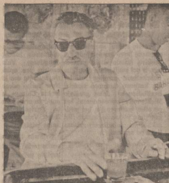
Adam Clinton Powell bijo sugrįžti į New Yorką, bet jis sukviėtė kelis draugus į Bimini ir papasakojo savo vargus. Atstovų rūmų komisija, patyrinėjusi jo elgesį, įsakė jam sugrąžinti į valstybės išdą 40,000.00 dolerių, kuriuos jis išleikvo. Jis tikėjosi didelės paramos iš negrų, bet ir jie jau kratosi tokio atstovo.