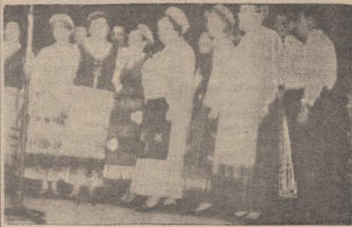
"Vilnelės" ansamblio choras