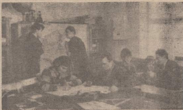
Mokytojų kambaryje Punsko mokykloje