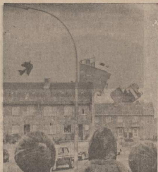
Šiaurės Vokietijoje praeitą savaitę siautė labai didelė audra. Fotografui pavyko nufotografuoti vėjo pakeltus stogus ir nulenktus elektros žviesos stulpus. Audra padarė didelius nuostolius.

Valstybės Departamento atsiųstuose atsakymuose yra ir daugiau svarbių problemų, prie kurių teks grįžti,