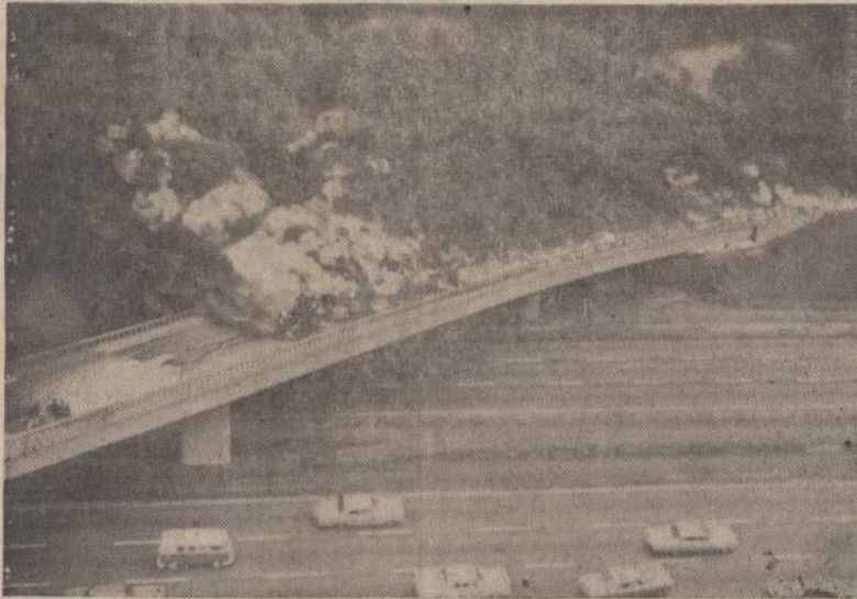
San Francisco mieste gazolina vežs sunkvežimio apvirto, paliejo gazolina ir sukėlė mylios ilgio gaisrą. Paliejus 8,000 galionų gazolino, buvo sustabdytas trafiką ir pakenkta dideliame Bay Shore tiltui.

Vedamasis daro išvadą, kad "yra faktas, kad naivūs mūsų vadai valdžioje ir senate neturi elementariausio supratimo apie komunizmo prigimtį ir apie sovietų diplomatijos metodus".