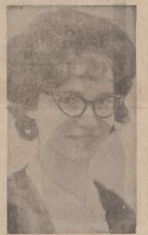
Carol Ann Fugate, prieš 9 metus važinėjo su Charles Starkweather po Wyoming - Nebraska valstybes ir dalyvavo keliuose užpuolimuose ir žudynėse. Devynis metus praleidusi kalėjime, dabar ji sako, kad ji pati nieko nežudėsi, bet tik buvo įsimylėjusi žudiką. Dabar karščiis jau atvežęs ir ji nebeneri be reikalo sėdėti kalėjime.