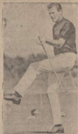
Miami, Fla., sportininkas Doug Sanders laimėjo $20,000 premiją už laimingą golfo kirtį.