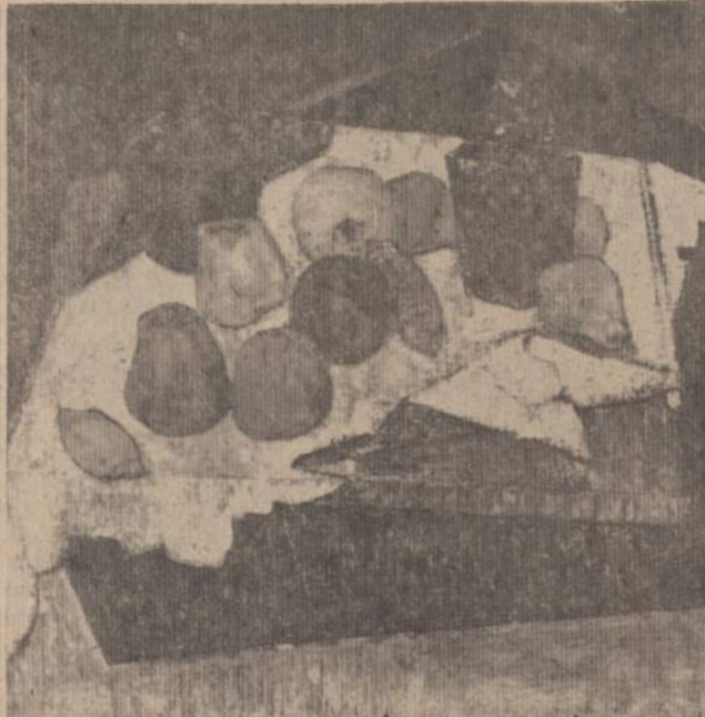
K. ZOROMSKIS "Naturmortalas" (tapyba) (Čiurlionio galerijos Chicagoje nuosavybė)

Jaunosios kartos dailininkų grupėje yra jaunesnių ir keletas vyresnių narių, atseit, ne išimtinai jaunesiems skirta būti grupės nariais. Ši grupė kaip ir primena prieš keletą dekadų buvusią Lietuvoje "Formą", "Ars" ir vėliau ta pati dailininkų grupė pasivadino Dailininkų Institutu, kuris jau daug metų nerodo gyvybės. Pastaroji nepri-