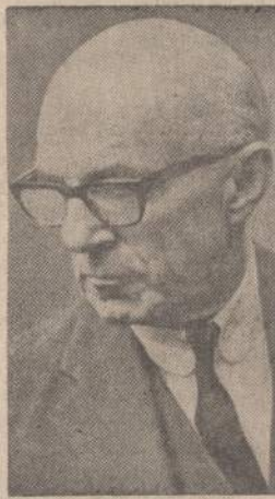
Vaikų gydytojas Benjamin Spock bendradarbiauja su Dr. Martin Luther King. Chicagoje jis reikalavo sustabdyti šiaurės Vietnamo bombardavimą, nieko neužsimindamas apie ginkluotų gaujų slaugą į pietų Vietnamą.

ROMA. — Katalikų vienuolės Brazilijoje turi atlikti kai kurias kunigų pareigas. Jau 10 parapijų, dėl kunigų stokos, yra aptarnaujamos moterų vienuolių. Jos atlieka visus patarnavimus, tik negali laikyti mišių ir klausyti išpažinčių.