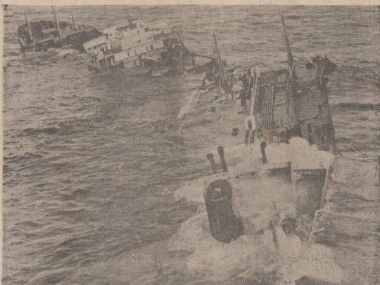
Ant uolos užplaukęs aliejui pervežti laivas Torrey Canyon lūžo, paleido aliejų ir užteršė aplinkumui. Britai aliejų apipylė benzinu ir bando sudeginti.

nizmo tikslams bus naudingesnė už Kastro pasiųstų teroristų pašiūdamą kalnuose su Pietų Amerikos kraštų kareiviais.