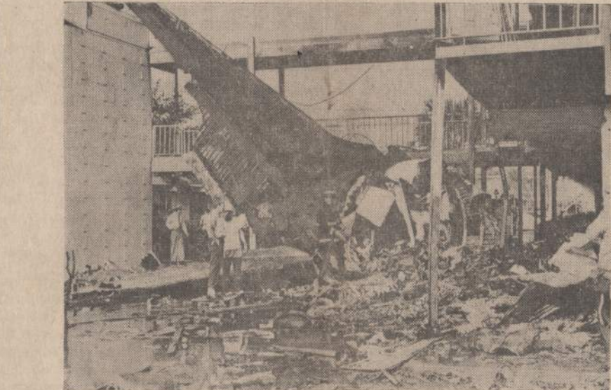
New Orleans priemiestyje Delta srausminis lėktuvas, besileisdamas įskrido į motelį ir užmušė 14 žmonių. Žuvo 5 žmonių igula, kuri buvo išskridusi lėktuvo išbandyti.