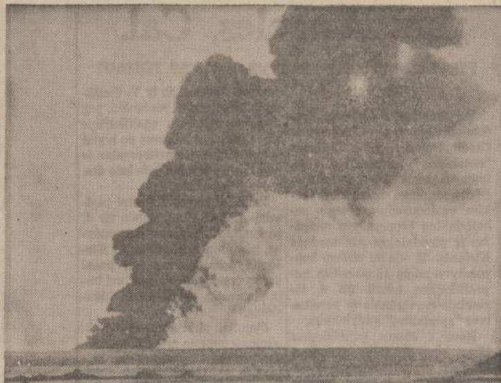
Britų karo aviacija išmetė 20 tonų sprogdamos medžiagos ant sulūžusio laivo Torrey Castle, kad sudėgtų atvežtas aliejus. Nepatyręs kapitonas kelis milijonus vertą laivą uždėd ant povandeninės uolos ir prarėžė dugną. Ant laiko užmestos bombos sukėlė matomą gaisrą.

6. Stipendija lituanistikai (kalbai, literatūrai, istorijai) studijuoti. Kandidatai turėtų būti baigę kolegiją ir siekia daktaro laipsnio. Stipendija duotina trims metams po 3000