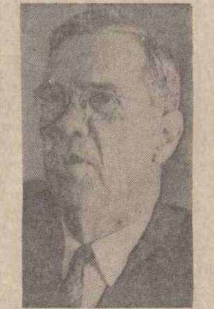
William McChesney Martin dar vienam terminui paskirtas Federal Reserve Banko pirmininku. Prezidentas Johnsonas, pasitaręs su įtakingaisiais senatoriais, pasirašė paskyrimą.