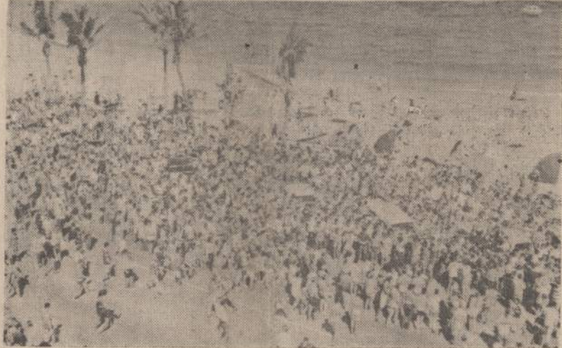
Fort Lauderdale, Fla., miestelin ir pajūrin buvo suvažiavę keli tūkstančiai studentų. Dvi dienas ir vieną naktį jie ten paško, padainavo ir ramiai vėl išsikirstė. Ši metų policijai neteko su studentais grumtis.

— Kovo 15 d. Maskvoj savo pasirodymus (rusų revoliucijos sukakties proga) pradėjo Kauno dramos teatras. Vaidino neseniai inscenuotą K. Borutos "Baltaragio Malūna". (E)