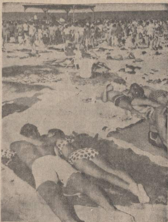
Velyku atostogų metu į Lauderdale paplūdimį suvažiuo 75,000 Floridos ir kitų valstybių studentų. Ši meta apsiėjo be riaušių. Policija suėmė kelis asmenis, bet vėliau paaiškėjo, kad jie nebuvo studentai. Studentai pasimaudė, pasoko pagal afsivežta muziką, padainavo, išvargo ir išvažinėjo. Lauderdale biznieriui išpardavė visas maisto ir lengvųjų gerimų atsargas.