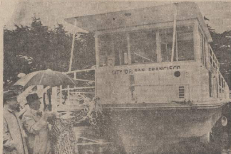
Plaukiojanti ligoninė "City of San Francisco" plauks į Mekong upės žiotis ir ten gydys vietos žmones. Laivas turės visus modernios klinikos įrengimus.