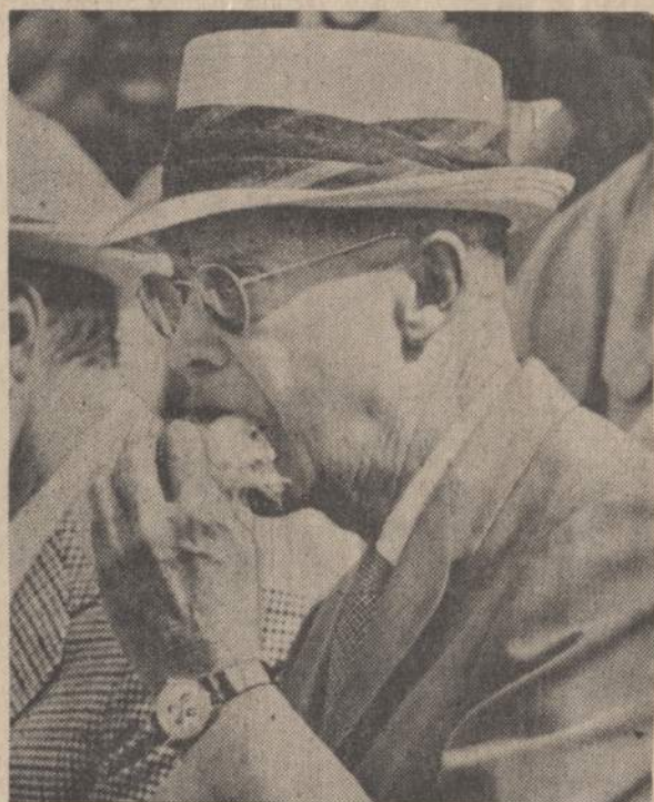
Prezidentas Eisenhoweris, Palm Springs, Cal., valgo dešrelę ir sėka beisbolo žaidimą.

Atžygiavę savo kaimynų eilėse, fejerverkams sproginėjant, prožektoriumi padangėmis besigraibstant ir šlapiems kaimynams linksmai šūkaujant, kandidatas antradienio perrinkimams meras Richard Daley ilgesniame žodyje pasisakė esąs laimingas gyventi tarpe kaimynų žmonių, kuriais didžiuojasi, laimingas turėdamas išistikimus gerus draugus, jo neįleidusius gerais ir blogais