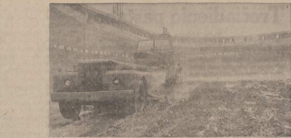
Pavasario sezonui ruošiami Bostono Red Sox aikštė. Pirmiausia visa aikštė "išprošina" didelę šildomąją mašiną, kad žemėje nebūtų ledo ir drėgmės, o vėliau jau imasi kity priemonių aikštei paruošti.