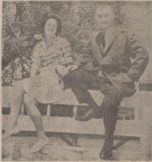
Prezidentas Johnsonas pakvietė pietų Amerikos ambasadorius praleisti savaitgalį savo ūkyje. Kol visi svečiai susirinko, tai ponia prezidentinė ir prezidentas susėdo ant iveros. Rytė keli ambasadoriai buvo išvažiuo į San Antonio ir apžiūrėjo Hemis Fair.

KAIRAS. — Egipto prezidentas Nasseris kartu su Mauretano prezidentu paskelbė pareiškimą, kuriame reikalaujama sustabdyti lėktuvų puolimus šiaurės Vietname.