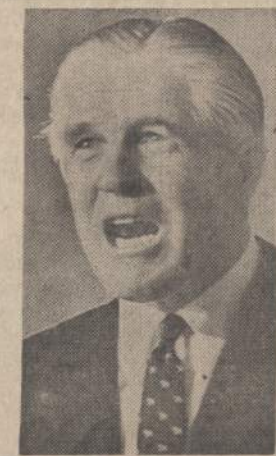
Gub. George Romney laimėjo rinkimus, bet kai paprašė padaryti pakaital valstijos mokesčių įstatyme, tai Michigan įstatymų leidėjai pasipriešino.

Pietų Vietname keturi vietnamiečiai kareiviai ir 30 civilių buvo sužeisti, kai amerikiečių lėktuvas netyčiomis apmėtė bombomis draugišką kaimą. Vadovybė šį incidentą taria.