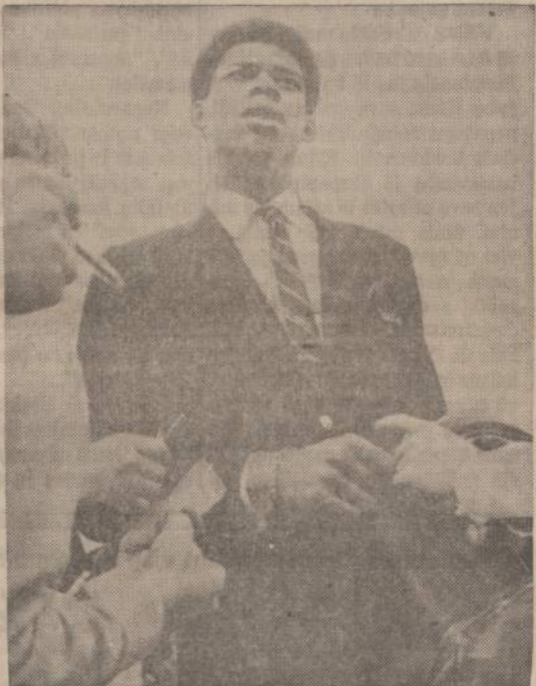
Geriausias JAV krepšininkas Lew Alcindor duoda beisbolininkams mėgėjams savo autografus. Alcindor padėjo Kalifornijos Universiteto komandai laimėti rungtynes Louisville, Ky., aikštėje.