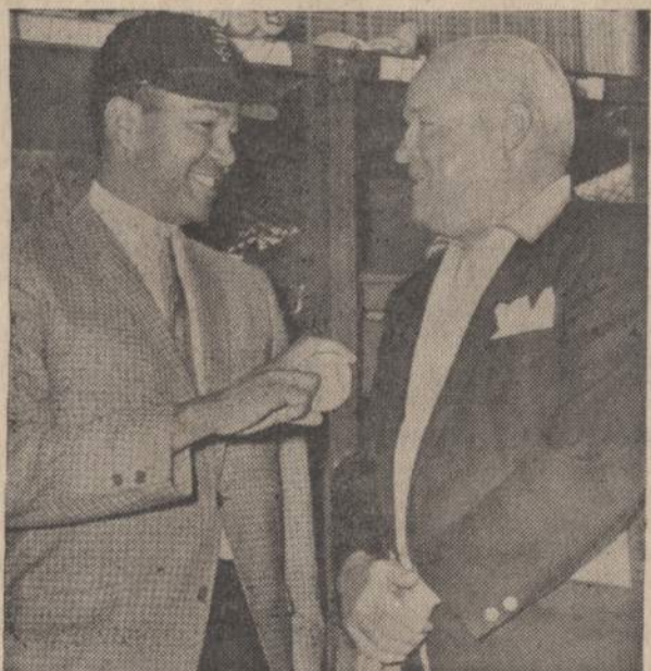
Juan Marichal (kairė) tarsi su San Francisco beisbolo klubo savininku Horace Stoneham dėl ateinančių metų algos.