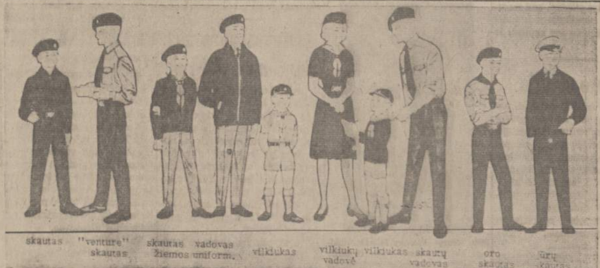
skautas "venture" skautas, skautas vadovas, vilkiukas, vilkiukas, vilkiukas skautų, oro, jūrų

1739 So. Halsted Street Chicago 8, Illinois