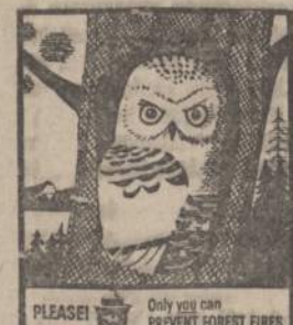
PLEASE! Only you can prevent forest fires.