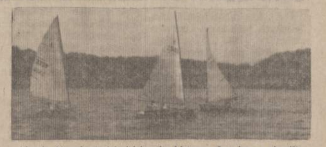
Lietuvių Jūrų skautų laivai laisvosios Lietuvos ežero bangas skrodžia