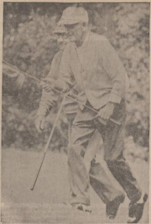
Ilgų metų golfininkai, vienas sulaukęs 82 metų, o antras 84, Augusta, Ga., atidare rungtynes golfo meistro titului įsigyti. Jie du šiose rungtynėse nedalyvauja, bet jie gali duoti gerus patarimus.

Čia jaunimas kitoj aplinkoj ir kitose sąlygose. Kad ir daug jis apie Lietuvą girdi, bet aplink jį verda kitas gyvenimas. Todėl ir visa dabar jo gyvenamoji aplinka savaime jam darosi artimesnė. Pagaliau ir laikotarpis dar savo; keičiasi papročiai, mados, aplinka, santvarka, gyvenimo standar-