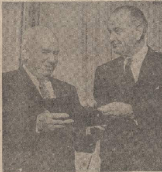
Balandžio 11 d. Washingtono įvykis didžiosios beisbolo rungtynės. Lygos prezidentas Warren Giles įteikia prezidentui tiketą ir, prašo, kad jis atvyktų į aikštę ir pasidžiaugtų rungtynėmis. Prezidentas padėkojo, bet neprizadėjo, gali kartais laiko neturėti.

LONDONAS. — Mokslinis britų žurnalas "New Scientist" aiškina vedamajame, kad cigaretės padeda rūkoriais išlaikyti ambiciją ir norą atsiekti, pasižymėti. Žurnalas sako, kad nikotinas smegenyse padeda susidaryti chemikalui "acetyl-choline", kuris sumažina įtempimą ir padidina užsispyrimą atlikti sunkius darbus.