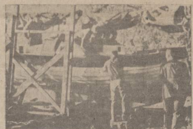
Pavasaris jau čia pat — skubame remontuoti laivus... Čikagos Jūros tauty skautai, skautės prie laivo remonto darbu.