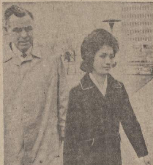
Slaugė Corason Amurao, sargybinio lydimą, eina į Peoria, Ill., prisiekusiųjų teismą, kad galėtų liūdyti apie Richard Specko elgesį slaugių namuose.

Miss Corason Amurao liūdią aštuonių slaugių žudiko Specko teisme