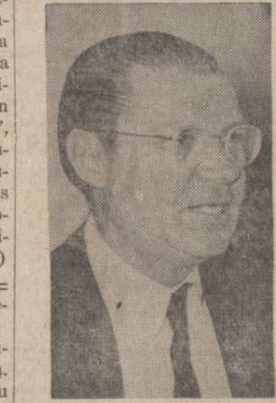
Kongreso užsienio komitetas nutarė sumažinti 596 milijonais dolerių užsienio valstyboms teikiama karo medžiagos parama. Krašto apsaugos sekretorius McNamara prašo nemažinti tokios sumos, nes tai galėtų pakenkti paliai Amerikai.

LONDONAS. — Viena jauna anglė pradėjo akciją prieš rūbų valyklas, kurios nedaro nuolaidų "mini-sijonams", imdamos tiek pat, kiek už ilgų išvalymą.