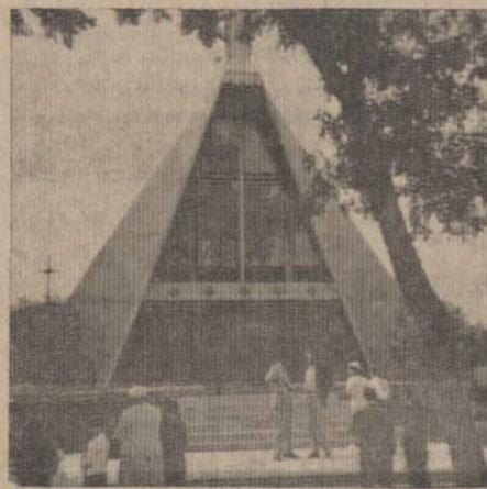
Winnipegas lietuvių šv. Kazimiero bažnyčia.

Bet pernai baigtoji statyti prie Pinavos (Pinawa) Winnipeg upės pakraštyje tarp Septynių Seserų krioklio ir Lac du Bonet ežero atominė laboratorija, pavadinta Whiteshell Nuclear Establishment, skaitoma viena iš galingiausių visame pasaulyje.