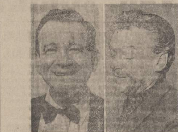
Artistai Walter Matthau (kairė) ir Paul Schofield geriausiai vaidin- sijai vyrui. Oskari jiems buvo įteikti praėjus pirmadienį.