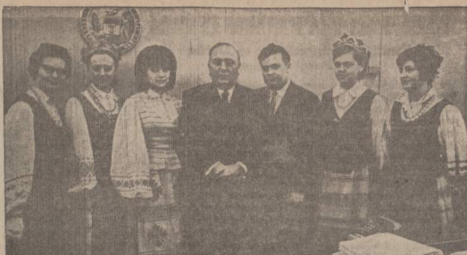
Chicago meras Richard J. Daley pareiškė, kad jis labai gerai pažįsta lietuvius ir jam patinka lietuvalis. Jos yra darbščios ir pareigingos. Paveikslė matome Chicago merą ofise nusifotografavusį su būriu atvykusių lietuvalių.

Jei negrai turėtų daugiau tokių Bunche, kurie sugeba blaivai galvoti, tai ir jų vedama kova nepasizymėtų kraštutinybėmis, kurios atneša daug daugiau bėdies, negu naudos. Tačiau nelaimė yra ta, kad labai dažnai nuosaikius vadus nustelbia demagogai. Taip yra ir tarp kitų rasų.