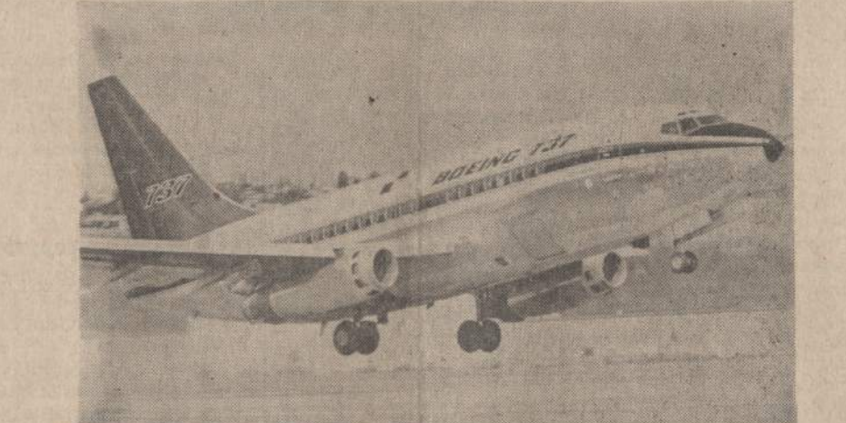
Naujasis Boeing 737 sprausminis keleivinis lėktuvas. Jis labai panašus į garsiąjį Boeing, kuris pastatytas ilgomis kelionėms. Paveikite matomas sprausminis lėktuvas pritaikytas 100 — 1,000 mylių kelionėms. Lėktuvas jau išbandytas. Seattle, Wash., aerodrome jis kyla į padangas.

tik 7.5 milijonų dolerių. Juos Lenkijai leidžiama sumokėti per septynerius metus.