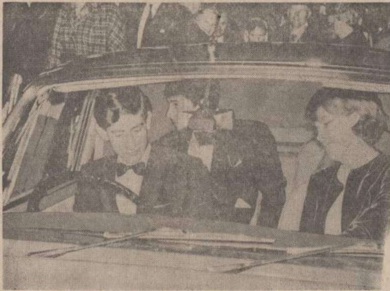
Visas Londonas kaiba apie gelsvaplaukę, su kuria 18 metų princas Charles nuvažiuo į Kiną. Pradžioje niekas nežinojo jos pavardės, bet vėliau paaiškėjo, jog tai yra australietė, su kuria princas praeitais metais susipažino ir pakvietė į Londoną.

Kina ir tai, kad šiaurės Vietnamo ir Kinijos geležinkeliai yra nevienodo pločio. Visas siuntas tenka arba perkrauti iš vieno vagono į kitus, arba vietnamiečiai nešikiai neša krovinius per sieną ant savo nugarų.