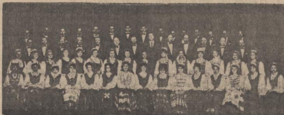
Kanados lietuvių "Varpo" choras.

Kas bilietų iš anksto neįsigijote, galite drąsiai į Fordo auditoriją važiuoti. Ten juos nusipirksite prie kasos. Jokių būdu netikiu, kad beveik dviejų tūkstančių vietų salė būtų perpildyta ar pripildyta. Galima tik viltis, kad ji būtų artipilnė. O artipilnė ją padaryti galime tik mes, lietuviai, jeigu mūsų tmsų tūkstantis ar arti tūkstanties susirinksimė.