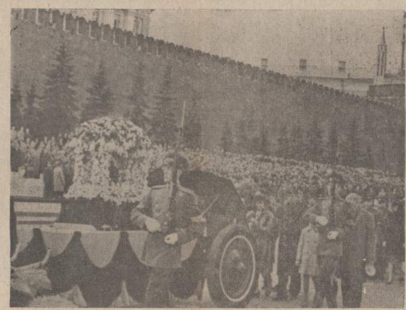
Kosmonautas Vladimir Komarov paskelbtas Sovietų Sąjungos didvyriu, o jo pelenai palaidoti Kremliaus sienoje. Komarovo vairuojamas erdvėlaivis nepajėgė sulėtinėti savo greičio. Tirštos žemės atmosferon jis nusileido visu smarkumu, užsidegė ir užmušė kosmonautą.

Į klausimą, ar ji priims Amerikos pilietybę, Stalinaitė atsakė, kad prieš bet kurias vedybas turinti būti meilė. Jei Amerika tų mėlės, jei ji įsimylės į Ameriką, tai tada taps piliete. Dabar ji nežinanti, kas įvyks toliau.