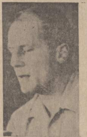
Aviacijos pulk. Robin Olds Antrojo Pasaulinio karo metu numušė 24 vokiečių lėktuvus, o Vietnamo jame pasiekė nuimti jau du komunistų sprausminius lėktuvus. Vietnamo fronte jis vadovauja sprausminių lėktuvų eskadrilei.