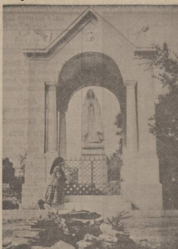
Pope Julius VI, ieškomas pasaulio taikos, gegužės 13 dieną skrenda į Portugaliją, kad galėtų pasimelsti prie stebuklingos Fati- mos koplyčios.