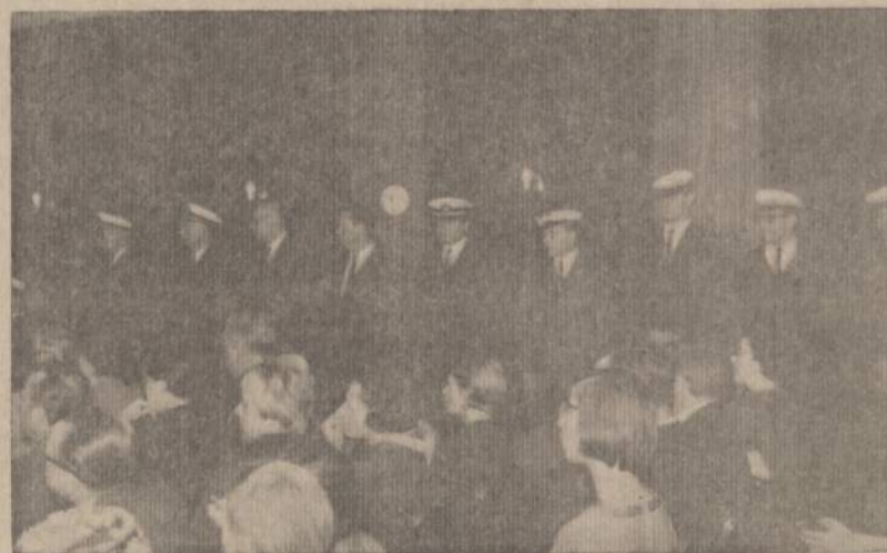
Baltijos Jūros tundo budžiai ir korp. Gintaras nariai LJS jubiliejinę dieną švenčiant.