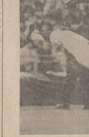
San Francisco sviedėjas Juan Marichal meta sviedinį. Jis, žaisdamas prieš New Yorko sportininkus, laimėjo 18 kartų.

Iš ko galima pažinti motociklistą? Iš jo dantyse prisivėlusiu užsimušusių vabalų.