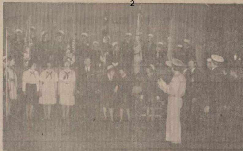
LJS vėliavos ir vadovėms jubiliejinių iškilnių metu Čikagoje.