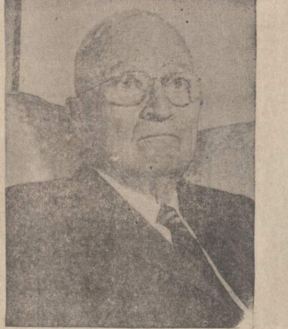
Pirmadienį, gegužės 8 dieną, buvęs prezidentas Trumanas minės savo 83 metų sukaktį. Jis gyvena Independence, Mo., miestelyje ir papildė savo atsiminimus.