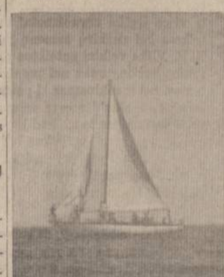
Pavasaris, laivai į vandenį nuleisti ir bursės jau plaukia...

Svečiams kviešti į stovyklą bus atspausdinti specialūs kvietimai, kurie dar prieš stovyklos pradžią bus išsiuntinti visiems LJS padalinimams, kviešti rėmėjus, tėvus ir vietas lietuvių visuomenės veikėjus aplankyti Jubiliejine stovykla.