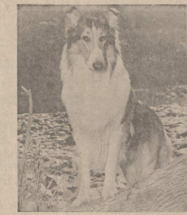
Prezidentas Johnsonas šią išgarsintą Lassie nori padaryti krašto švaros simboliu.