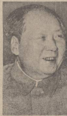
Iki šio mėto priešingos Kinijos komunistų srovės grūmėsi plakatais, lipnamais miestų lentose ir sienose. Praeiti savaitę pirmą kartą buvo šiai kovai panaudota valstybinė televizija. Teks Mas Četungas buvo parodytas kiniečių televizijoje.

JAKARTA. — Indonezijos žuvantį draugiją atėmė iš buvusio prezidento Sukarno "Didžiojo žuvantojo" titulu.