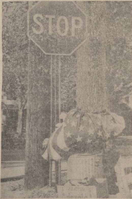
Mirus veteranui, namo šeimininkai surišo visus Antrojo Pasaulinio Karo veterano daiktus į vėliavą ir išnešė. Tekiu namo savininko elgesiu susidomėjo Georgia valstijos, Atlanto miesto veteranai. Net ir karo veterano likusių daiktų negalima risti į vėliavą.

lomatiniai atstovai taip pat yra tuo reikalui įteikę memorandumus. (E)