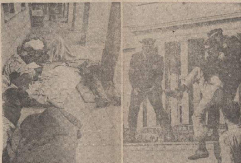
Protestuotojai prieš karą Vietnamo buvo išmesti iš Pentagono. Tada jie sulindė į maišus ir miegojo šalia namo, bet paryčiu atsiradusi policija juos ir iš ten išprašė. Negalima valstybės ir savivaldybės įstaigose ardyti tvarkos.

Vilniaus laikraščiai pranešė, kad naujajame žurnale, šalia jaunųjų prozininkų bei poetų kūrybos, spindi tokia svarbiausia "najenybė": 1918-19 metų sąvartoje Vilniuje buvusios jėkūrusios bolševikinės Kapsuko valdžios... telegramų Leninui nuorašai. (E)