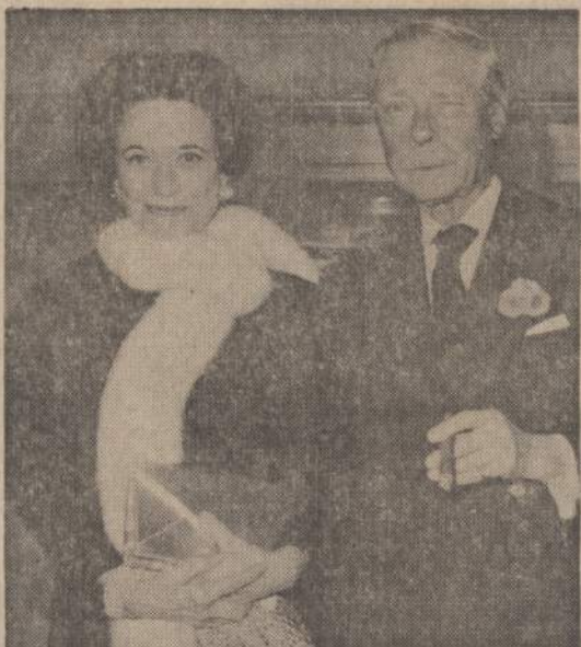
Anglijos karalienė Elzbieta pakviėtė buvusį karalių Edwardą VIII ir jo žmoną Wally Simpson birželio 7 d. dalyvauti Buckingham rūmų iškilmėse. Wally Simpson, dvirusota amerikietė, pirmą kartą pakviesta į karališkas iškilmes.