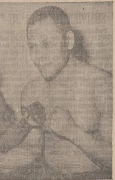
Atėmus nusikaltusiam boksininkui čempiono titulą, geg. 16 dieną lengvesnio svorio čempionai Dick Tiger (kairė) ir Jose Torres persiūšė. Bandomajame susiremime laimėjo išėjo Dick Tiger.

Šiuo visu purvu beveik kasdien maitinami televizijos žiūrovai. Suaugusiems, beprasmiškai gaisinamo laiko, tas gal ir nepakeiks, bet vaikams geriausia mokykla, kaip užaugti kriminalistais. Kartais ir spaudoje skaitome, kad koks nors vaikėzas, prisiziūrėjęs televizijos, padaro sunkų nusikaltimą. Kad tokios programos žaloja augančius vaikus, manau, šiandien jau daugumas neabejoja. Štai vienas kitas mano pastebėtas pavyzdėlis: Atvyko reikalas