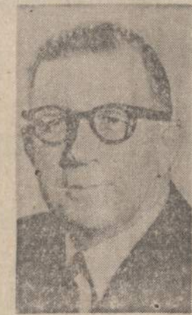
Stiprus advokatas Theophilus Donges išrinktas Pietų Afrikos prezidentu. Gegužės 31 dieną jis turėjo būti prisakdintas, bet staigiai išliko širdies smūgis. Gydytojai tvirtina, kad jo sveikatai susidarė labai rimtas pavojus.

WASHINGTONAS. — Bokslinkas Casius Clay kreipėsi į Aukščiausiąjį Teismą prašydamas sprendimo, jog jam, kaip juodųjų musulmonų kunigui nereikia eiti tarnauti kariuomenėje.