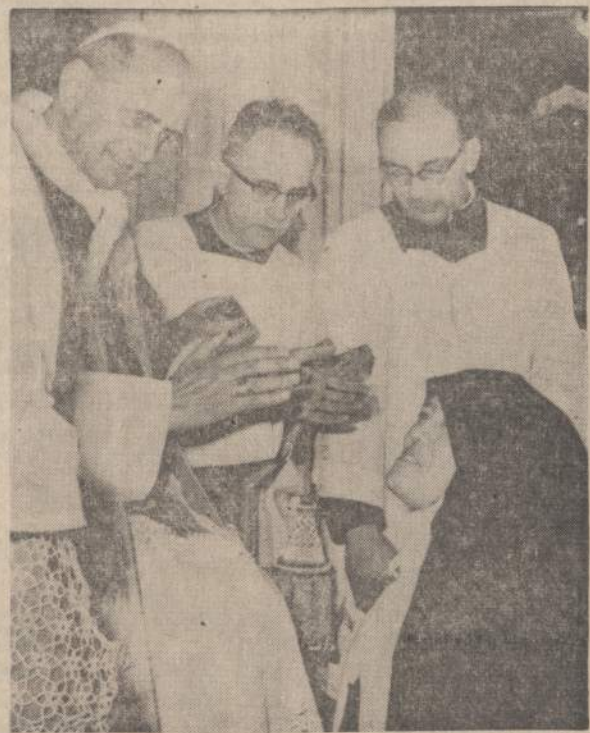
Trys milijonai portugalų pasveikino popiežiu Paulių VI-į, atskridu- sį į Fatimos šventovę. Prieš 50 metų trys portugalės piemenaitės pa- matė didelę žviesą, o vėliau užgirdo Fatimos balsą. Dvi jau mirė, o trečioji, tapusi vienuole Liucija, pasveikino atskridusį popiežių. Popiežius ją pabučiavo į kaktą ir davė dovanų, o ji supažindino po- piežių su artimaisiais savo giminėmis.

FASTEETH, pagerinti milteliai, ap- baredūs viršutinei ir apatine dantų plokšteli, priklaiko dirbtinius dantis savo vietoje. Jie neslysta, neiškrinta ir nesisupa. Napalėka limpančio, kli- juojancio, tešinio skonio ar kvapo. Sustabdo "plokštelių kvapą". Gerai tinkancios plokštelės yra būtinos svei- katal. Nuolat lankykite savo dantų gydytoją. FASTEETH galima gauti kiekvienoje vaistinėje.