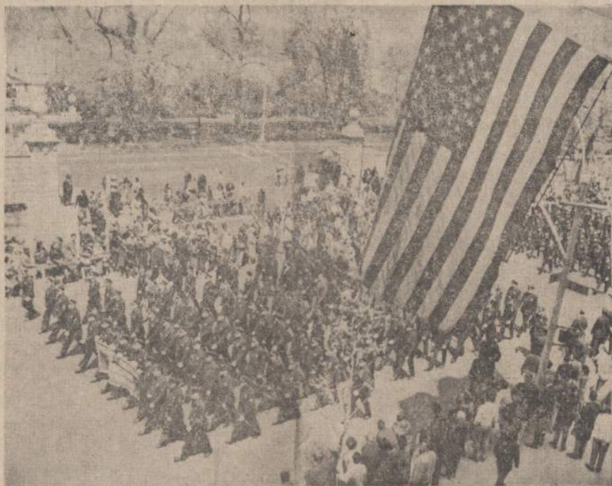
New Yorko gatvėmis pramariavo 250,000 žmonių, kurie pritarė vyriausybės politikai Vietname ir pasižadėjo remti Vietname kovojančius Amerikos karius. New Yorko gatvėmis ejo darbininkų unijų nariai, veteranų organizacijos, masonai ir įvairių tautų organizacijų atstovai. New Yorko gatvėmis maršavo didokas lietuvių skaičius.

JT komisija išaiškino, kad pastutinius kelis metus užsienio valstybių kapitalas Pietų Afrikoje padaugėjo 11%. Tas rodo, sakė komisijos pareiškimas, kad Amerikos, Britanijos, Prancūzijos, Šveicarijos, Belgijos interesai Pietų Afrikoje neleidžia joms pareikšti savo moralinio pasipiktinimo P. Afrikos politine linija.