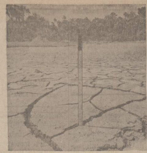
Floriadoje prasidėjo sausra. Paveiksle matomoje vietoje buvo Tomoka ežeras. Dabar jis ne tik išdžiūvo, bet jo dugne atsirado 9 colių pločio gilūs plyšiai. Sunyko visoki ežero gyviai.