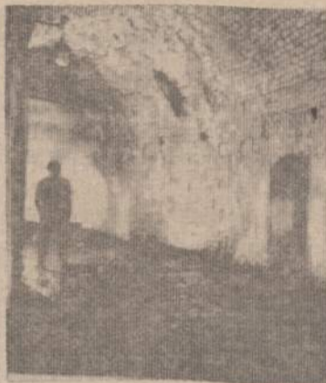
Dabartinis požeminis šaudyklos vaizdas

Visą Bokšto kalno papėdę juosia 120 metrų ilgio ir 8 metrų aukščio mūro siena, apriečianti kalną tarp Bokšto ir Subačiaus gatvių. Šios milžiniškos pasagos galuose priglausti požemio vartų priestatai. Juose įrengti vartai — vieninteliai išėjimai už miesto sienos, skirti slaptiems išpuoliams bei patrankų įvežimui. Vilnelės pašlaitė pereina į platų griovį, pastojantį mums kelią. Jau iš tolo mus seka budrios šaudymo angų akys. Jų kiaurymėse — patrankų žiotys. Apėję išoriniu krantu, per Subačiaus vartų pakeliamąjį tiltą patenkame į aptvertą miestą. Vidinė sienos puse, aukštai virš galvos visą senąjį Vilnių apibėga ištisinis medinis balkonas — gynybinė galerija su šaudymo angomis sienose, stabtelėdama ties kiekvienu miesto vartų bokštu. Iš Bokšto gatvės, pakilę laiptais į bastiono bokštą, pakliūvame į tamsią patalpą, be langų. Nuimamos kopėčios veda į viršutinius aukštus. Prieš akis — didžiulės durys į ilgą tunelį, einantį į kalno vidų. Pasišviesdami blausiu žibintu, leidžiamės vis gilyn ir už 50 metrų prieiname antrąsias geležim apkaltas duris. Patenkame į pusračiu išlenktą daugiau kaip šimto metrų ilgio, 4 metrų pločio ir 5 metrų aukščio patalpą