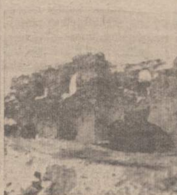
Bastiono bokštas, žiūrint iš Subačiaus gatvės.