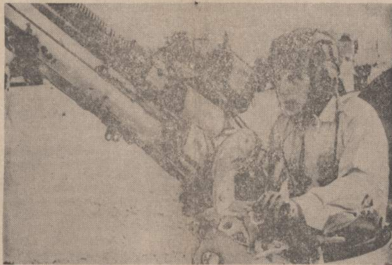
Prezidentas Naseris pareikalavo atšaukti Jungtinių Tautų karių iš Gazos srities. Visa pasienį saugos paveiksle matomos modernios Naserio armijos kariai. Jie naudoja naują aprangą ir Rusijoje gamintus ginklus.

Tada iš to "tokio" jau nebetenka ko nors laukti. Nes tada tik tam apkalntinajam belieka "laukti visko" iš visų pusių: iš butų valdybos, iš viršininkų tarnyboje, net iš bendradarbių bei kaimynų, susigūžiančių komunistinės "tolerancijos" akivaizdoj.