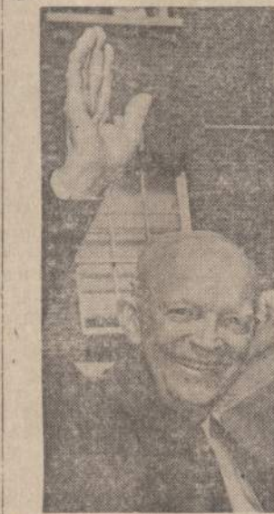
Buvęs prezidentas Eisenhower, kelias dienas pasigydyęs Walter Reed ligoninėje, išvažiuoja į savo ūkį, kur tiksliai visai atsigauš. Jis mano, kad žmona bus geriausia gydytoja.