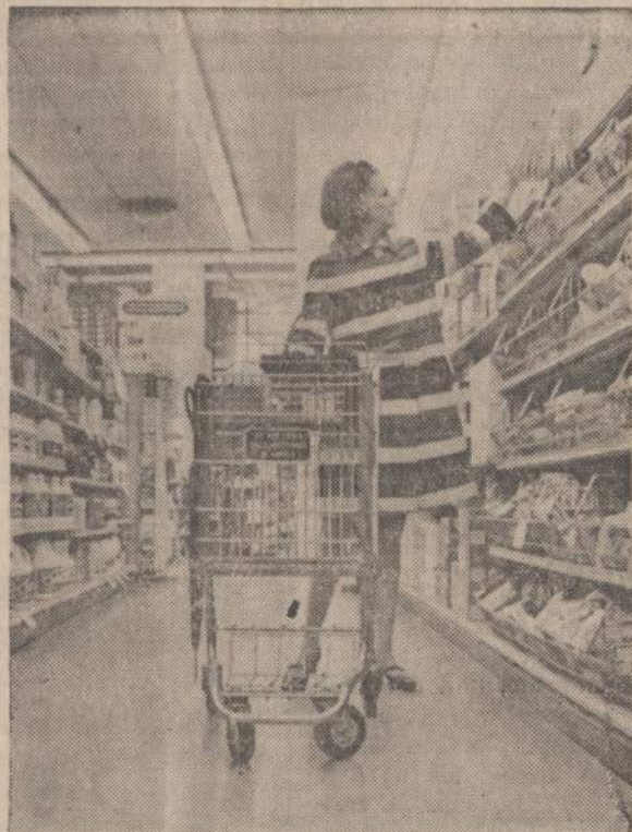
Prezidento Johnsono neseniai paskirta Betty Furness apžiūrinėja Washingtono maisto krautuvių išstatytas prekes. Ji įsipareigojo informuoti prezidentą apie vartojamas prekes.

PR 8-2781 ir LU 5-6291 bet kuriuo laiku ir pavyzdžius jums pristatys į namus.